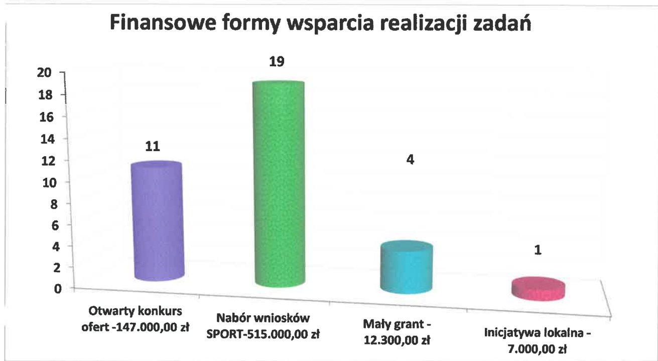
Wykres nr 1

Udzielono wsparcia finansowego mieszkańcom Gminy Kąty Wrocławskie na realizację 1 zadania publicznego w ramach tzw. inicjatywy lokalnej w wysokości 7.000,00 zł.