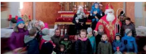
Rodzice dzieci z Nowej Wsi Kąckiej

Drogi Mikołaju pragniemy podziękować za spotkanie w dniu 4 grudnia i ogrom prezentów, które rozdałeś naszym dzieciom w kościele w Nowej Wsi Kąckiej. Moc uśmiechów i radość naszych dzieci niech będzie dla wszystkich Twoich pomocników i Ciebie wyrazem wdzięczności i wynagrodzeniem za trud oraz włożoną pracę na rzecz naszej lokalnej społeczności.