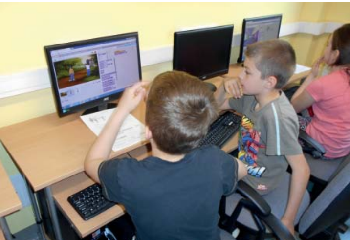
Zespół ds. promocji Szkoły

Dzięki naszym zajęciom uczniowie klas II zainteresowali się kodowaniem i zmotywowali się do dalszego zgłębiania tajników programowania.