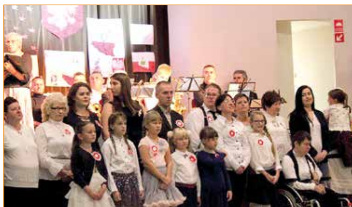
Kąty Wrocławskie, Stowarzyszenie „Krzyś – Byś Kolorowo Żył”