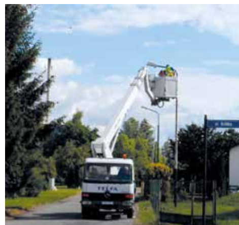
Gniechowice ul. Spokojna w trakcie realizacji

Zakończyła się modernizacja oświetlenia drogowego w rejonie osiedla mieszkaniowego SM „Ślęza” w Gniechowicach. Wymieniono nienadające się do dalszej eksploatacji słupy, a pozostałe zostały oczyszczone i zabezpieczone farbą antykorozyjną oraz wypionowane. Zabezpieczono wnętrza słupowe i wymieniono wysięgniki słupowe dwuramiennie na pojedyncze. W miejsce starych rżeniowych opraw zamontowano nowe oprawy sodowe o wysokiej sprawności.