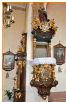
Ambona przed wykonaniem prac konserwatorskich