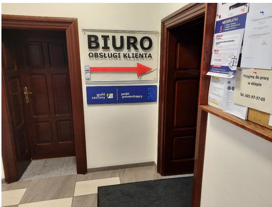
Tak wygląda Biuro Obsługi Klienta w środku