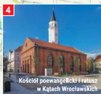
Kościół poewangelicki i ratusz w Kątach Wrocławskich