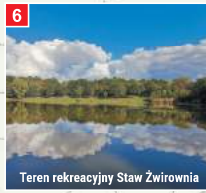
Teren rekreacyjny Staw Zwirownia