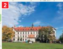
Malkowice - Centrum Opieki Caritas