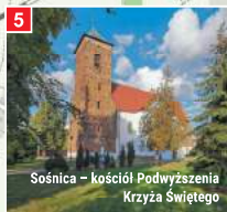
Sośnica - kościół Podwyższenia Krzyża Świętego