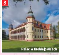
Pałac w Krobielowicach