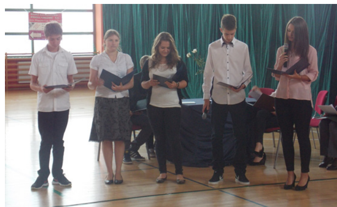
● Szkolny Klub Kulturalny

1 września to nie tylko początek roku szkolnego. To również jedna z tragiczniejszych dat w historii ludzkości. II Wojna Światowa była największym konfliktem zbrojnym w historii świata. W tym roku obchodzimy 74 rocznicę jej wybuchu. Nasi uczniowie rokrocznie oddają cześć Polakom-bohaterom wojny obronnej. Cios polskim nadziejom został zadany 17 września 1939 r. Wojska radzieckie wtargnęły wówczas na ziemię naszego kraju. Mimo ciemnej nocy okupacyjnej - terroru, masowych wywózek na roboty do Niemiec, obozów koncentracyjnych, Polacy wykazywali się wielkim patriotyzmem i poświęceniem. Podczas uroczystości wspólnie wysłuchaliśmy opisów bohaterstwa Polaków na tle przejmujących prezentacji multimedialnych. Ich pamięć uczciliśmy minutą