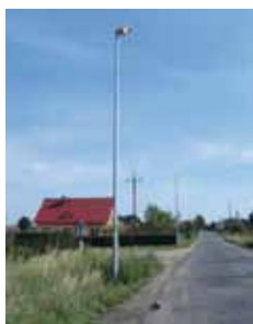
Zachowice ul. Żurawia

Zakończyła się budowa nowego odcinka oświetlenia drogowego ul. Żurawiej i ul. Różanej w miejscowości Zachowice. Wykonano również oświetlenie ul. Słonecznej, ul. Radosnej, ul. Szczęśliwej i ul. Stawowej w miejscowości Pietrzykowice. Powyższe prace wykonywali wyłonieni w przetargu nieograniczonym Wykonawcy: Zakład Robót Teletechnicznych TELFA ze Świdnicy oraz ETEC z Olkusza.