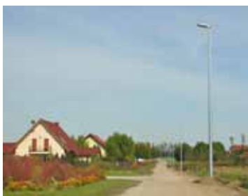
Bogdaszowice ul. Słoneczna

W trakcie realizacji jest budowa oświetlenia drogowego w Kębtowicach, ul. Słonecznej i ul. Ziołowej w Bogdaszowicach, ul. Lotniczej w Czerńczykach, ul. Porzeczkowej w Gniechowicach, ul. Jagodowej i ul. Truskawkowej