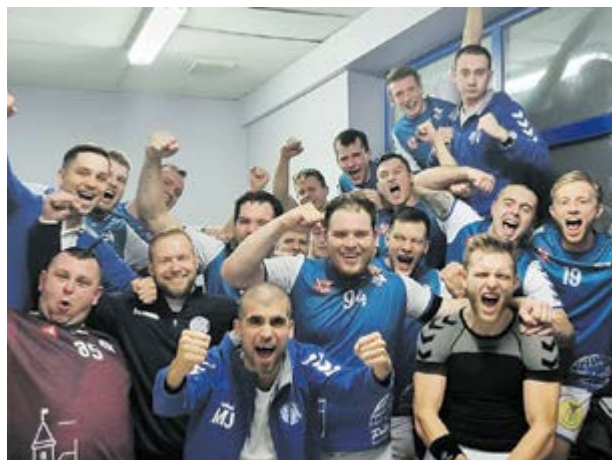
Nasi piłkarze ręczni Mistrzem jesieni

i zgromadził 30 punktów. Start II rundy rozgrywek zaplanowany jest na 29 stycznia, kiedy to nasz zespół uda się na mecz do Nowej Soli.