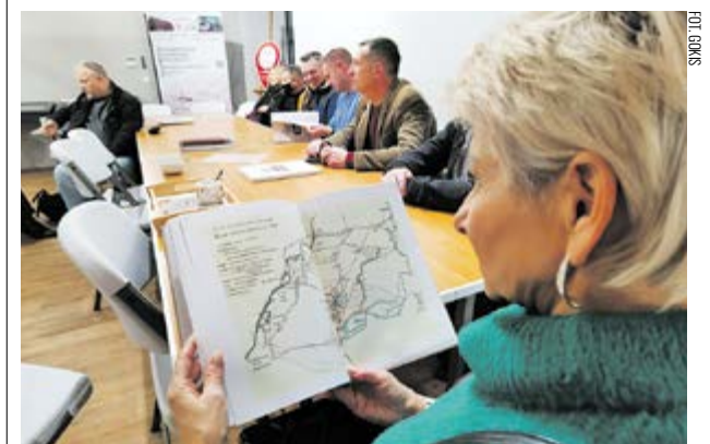
Wydana po polsku Kronika Romnowa