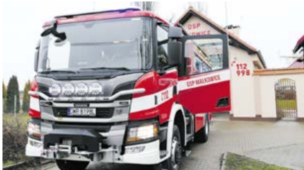
Nowy samochód ratowniczo-gaśniczy dla OSP Małkowice

Jednostka operacyjno-techniczna OSP Małkowice wyposażona została w nowoczesny samochód pożarniczy marki SCANIA N323 P320 z napędem 4x4.