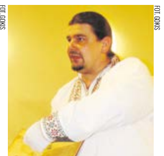
Prezentacja oryginalnej kroniki