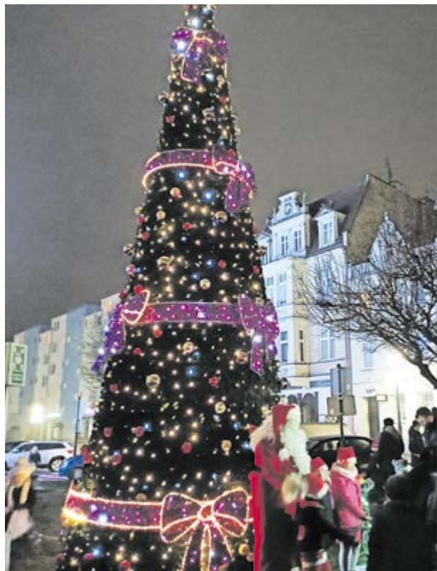
Mikołaj na kąckim Rynku