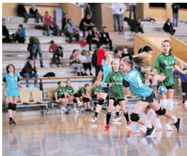
Zacięta walka o miejsce na podium