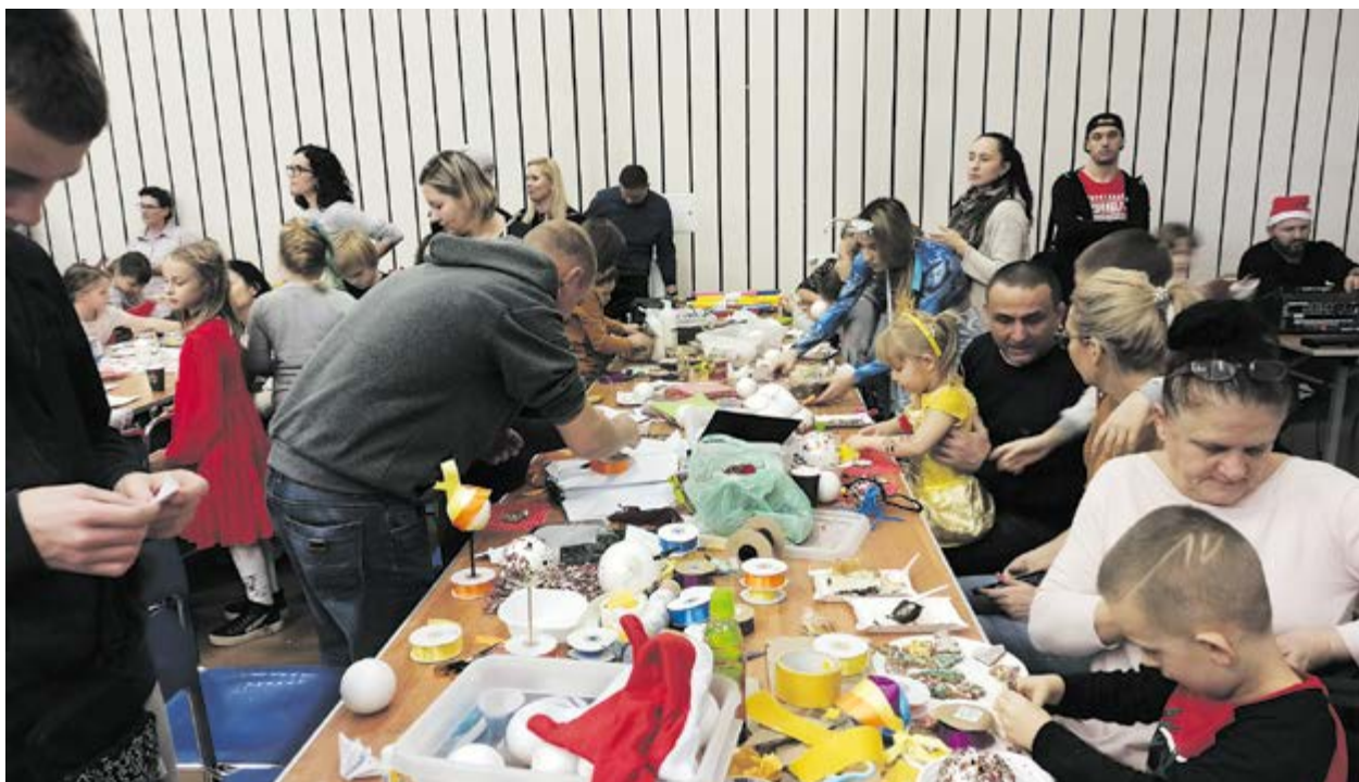
Kreatywne warsztaty z ozdób świątecznych