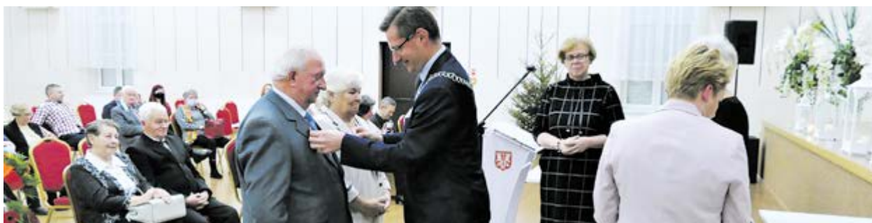
Wyręczenie medali na Jubileusz 50-lecia pożycia małżeńskiego