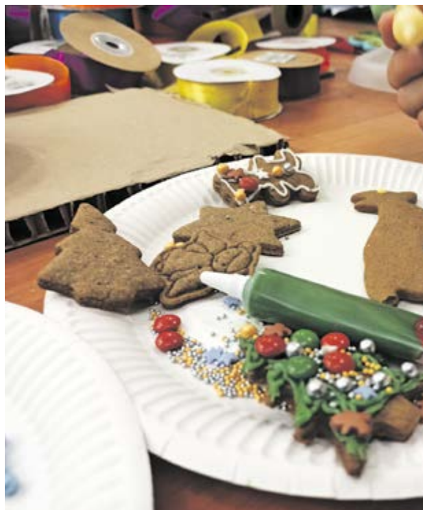
Wspólne ozdabianie pierników