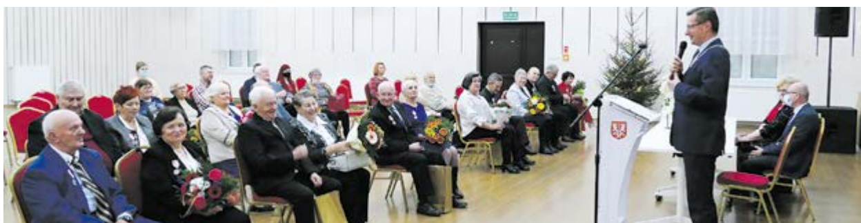
Odznaczonych medalem Prezydenta RP zostało 9 par