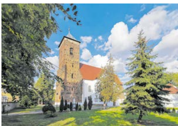
Zabytkowy kościół w Sośnicy