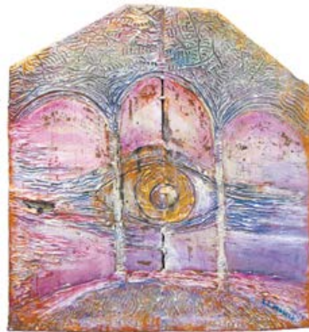
Trzy pokoje melancholii