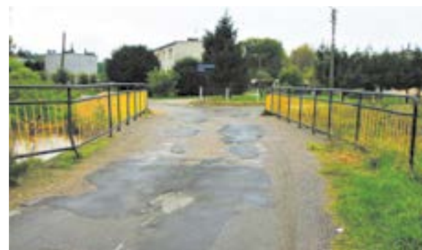
Aktualny stan mostu w Gniechowicach

Trwa przetarg na wykonanie nakładki asfaltowej oraz remontu nawierzchni jezdni oraz poboczy w Gniechowicach na tzw.ogrodach. W ramach zadania naprawiony zostanie również most, naprawione zostaną płyty pomostowe oraz balustrady.