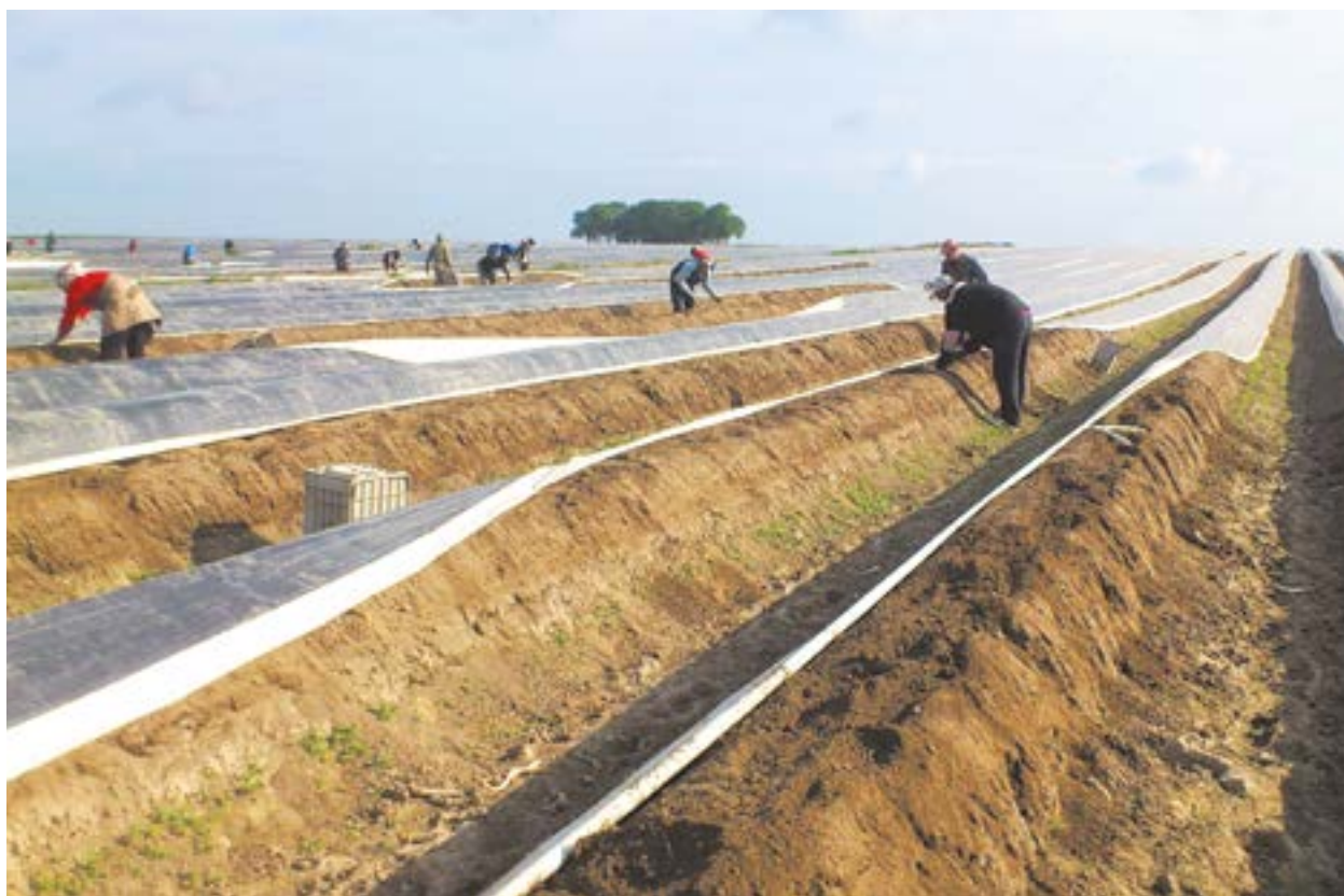
Zbiór szparagów na polu w Strzegomowicach