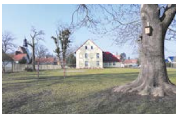
Tu ma powstać nowa sala gimnastyczna

Czekamy na wyniki konkursu na dofinansowanie sali gimnastycznej przy szkole podstawowej w Małkowicach. Jednocześnie trwa opracowywanie dokumentacji projektowo-kosztorysowej.