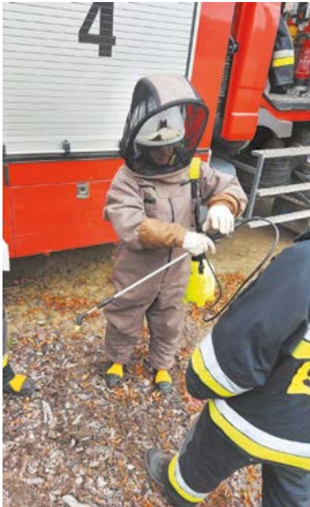
Lato to czas wyjazdu do uciążliwych i często zagrażających zdrowiu i życiu, gniazd os i szerszeni.

W minionym roku, działania druhów Ochotniczej straży Pożarnej skupiły się na pomocy związanej z pandemią COVID-19. Poprzedni rok to również walka z żywiołem, jakim była powódź.