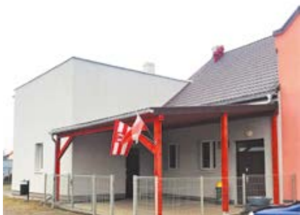
Nowe zadanie przy świetlicy w Kozłowie

Kontynuowane są prace przy remontach świetlic wiejskich. Do tej pory w nowe meble do kuchni i wyposażenie zaopatrzone świetlice w Romnowie, Mokronosie Dolnym, Pełcznicy i Strzeganowicach. Wybudowano zadania nad wejściem do świetlic w Kozłowie i Sokolnikach. W Skalce wykonano remont odwodnienia dachu, zmieniono sposób ogrzewania budynku na energooszczędny i wykonano cyklinowanie posadzki wraz z malowaniem. W Cesarzowicach wymalowano elewację oraz wnętrze świetlicy. Założona została również klimatyzacja. Wykonane zostało ogrodzenie wokół świetlic w Wojtkowicach i Kilianowie. Wyremontowano toalety w Nowej Wsi Kąckiej oraz Zachowicach. Dodatkowo w Zachowicach zmodernizowano instalację kanalizacyjną, ogrzewanie i oświetlenie. Położono również nowe kafle na podłodze i ścianach. Wykonano izolację ścian w świetlicy wiejskiej we Wszemiłowicach. Teraz trzeba skuć tynki, wysuszyć i wykonać je na nowo. Następny etap to instalacja drenażu budynku, co uniemożliwi zalewanie piwnicy wodą.