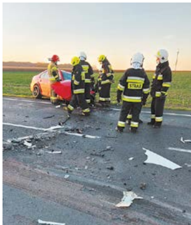
Strażacy z terenu gminy często uczestniczą w akcjach ratowniczych na drodze ekspresowej A4 oraz drodze nr 35.