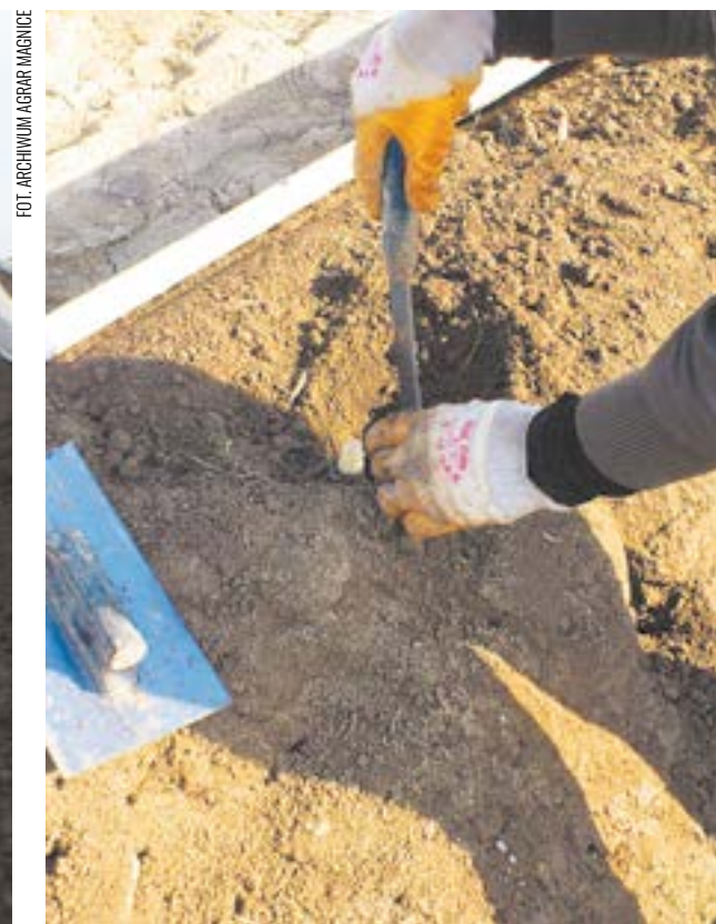
Szparagi można zbierać wyłącznie ręcznie