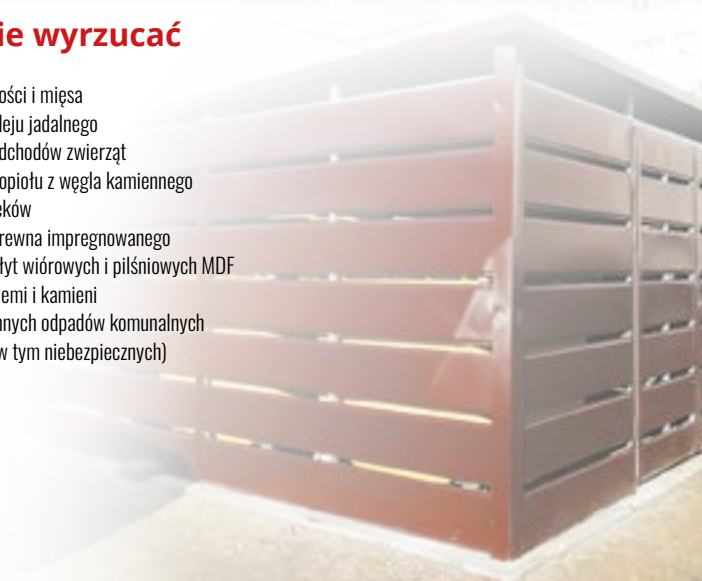
Nowe boksy na odpady przy ul. Kościuszki.