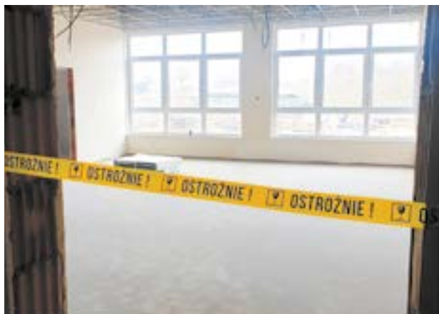
Wewnątrz obiektu wykańczane są kolejne pomieszczenia

Trwają intensywne prace budowlane, w tym wykończeniowe. Wewnątrz budynku trwają prace tynkarskie, posadzkarskie, elektryczne i sanitarne. W trakcie jest zagospodarowanie terenu wokół obiektu. Położone jest już pokrycie dachowe.