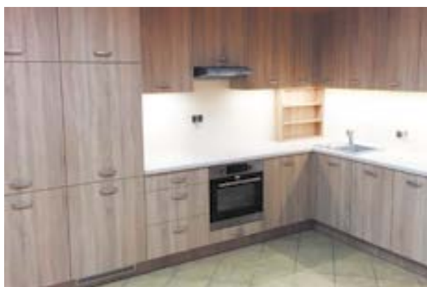
Doposażona świetlica w Mokronosie Dolnym