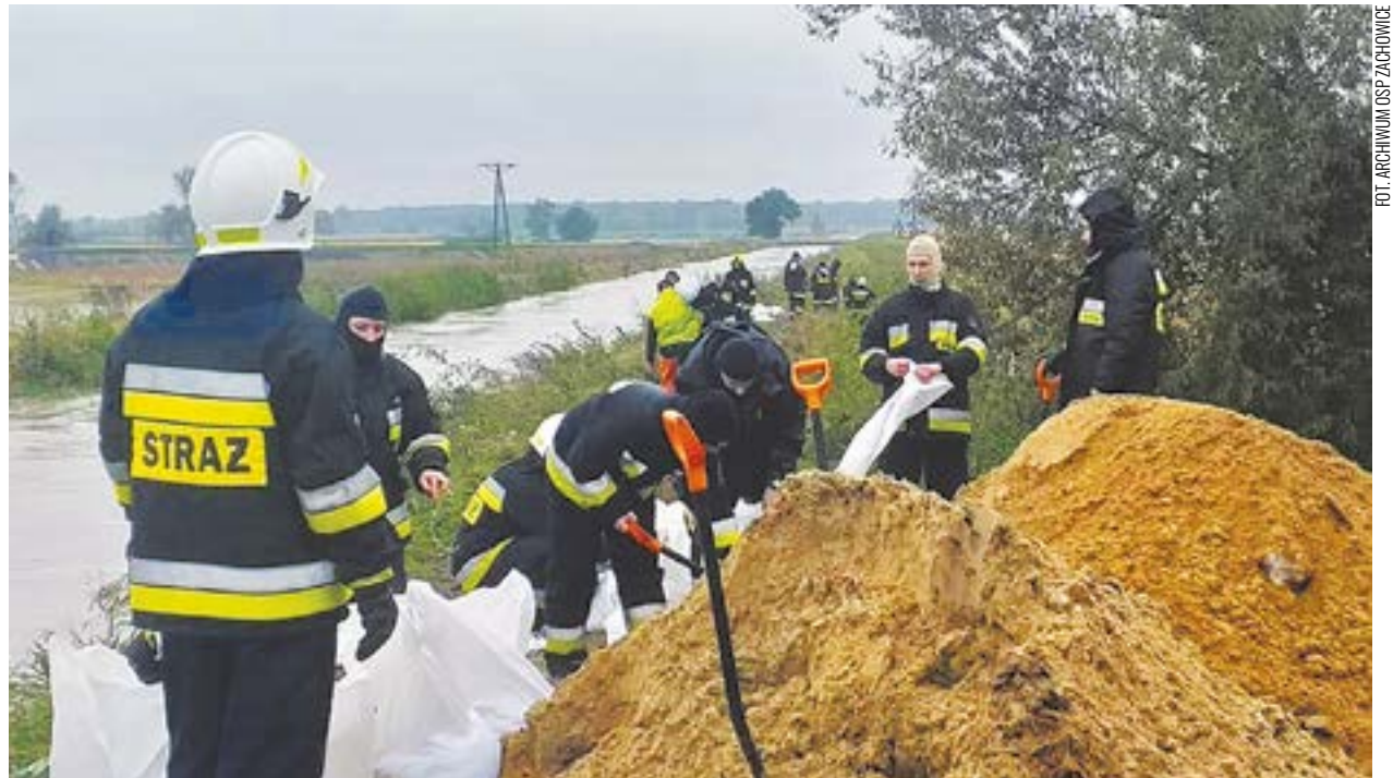
Dzięki pracy strażaków, podczas powodzi w 2020 r., udało się zminimalizować skutki działania żywiołu.

W trakcie roku członkowie OSP są dysponowani do licznych wypadków drogowych, walczą z pożarami, jak pożary domów, zapaleń sadzy w kominach lub stert słomy. Na terenie gminy Kąty Wrocławskie działają 4 Jednostki Operacyjno-Techniczne Ochotniczych Straży Pożarnych: OSP Gniechowice, OSP Małkowice, OSP Smolec oraz OSP Zachowice.