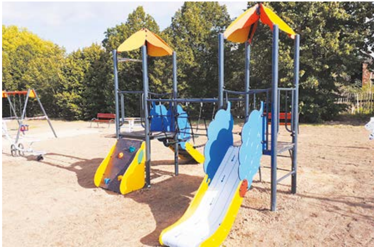
Plac zabaw w Czerścycach

gminnych terenów rekreacyjnych. Zakupiona ma zostać piaskownica, drewniany zestaw zabawowy, huśtawki, ale i góra wspinaczkowa oraz urządzenia do ćwiczeń siłowych.