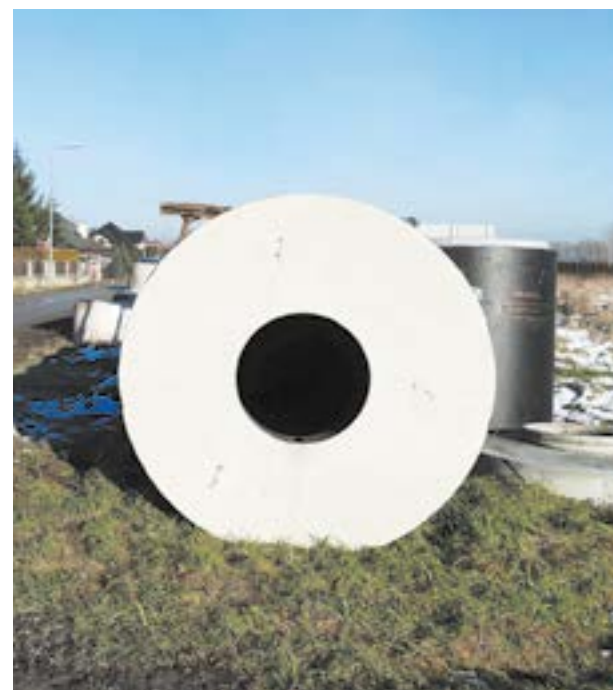
Prace przy budowie przepompowni w Mokronosie Górnym