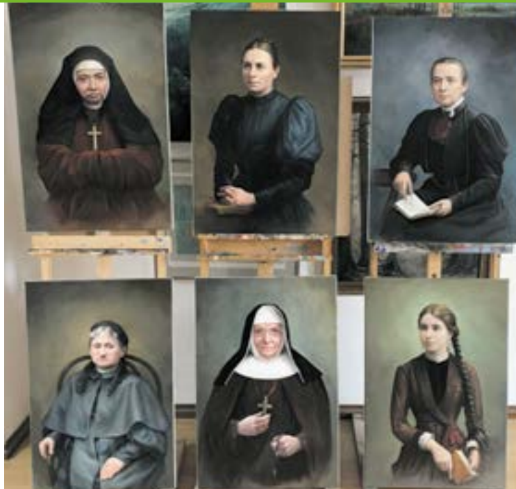
Portrety założycieli zgromadzeń zakonnych już wiszą w kaplicy w Licheniu.