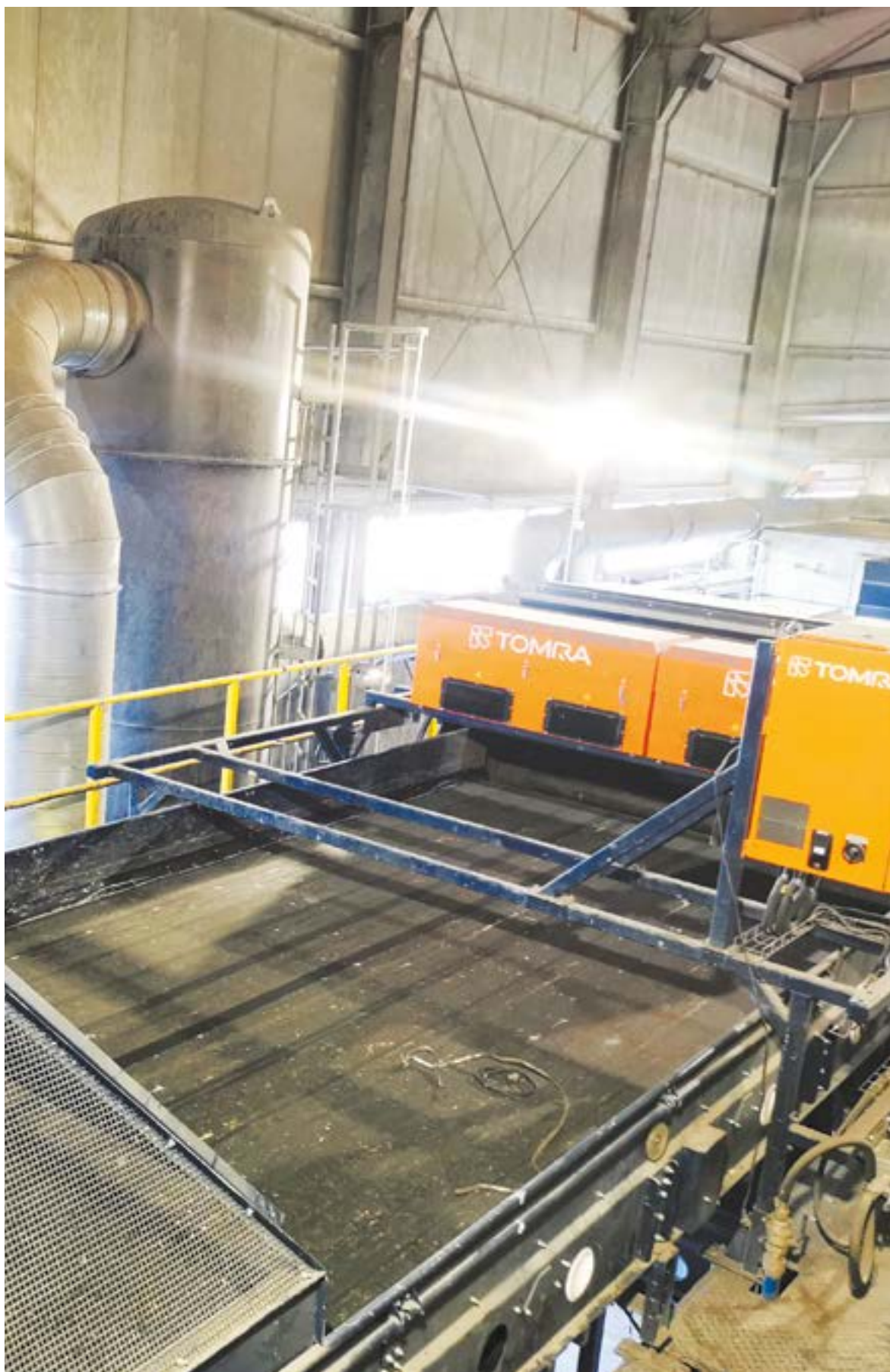
Powyżej i na stronie obok: Sortownia odpadów WPO Alba S.A. we Wrocławiu, jedna z najnowocześniejszych instalacji odzyskiwania odpadów w Polsce.