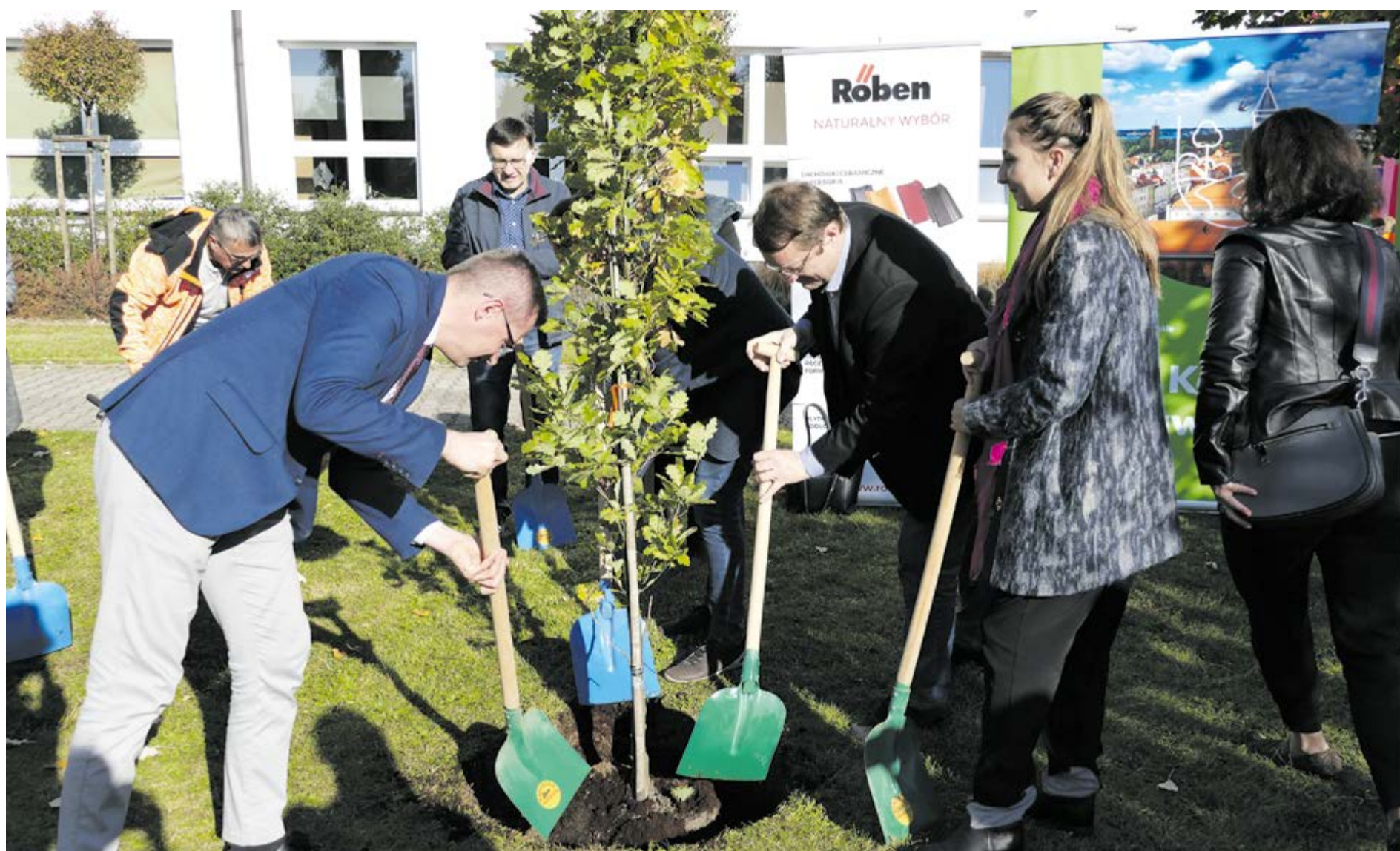
Wspólne posadzenie pamiątkowego dębu z udziałem władz gminy oraz przedstawicieli firm partnerskich