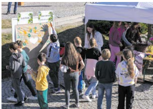
Uczestnicy mogli zaprojektować własne eko stroje