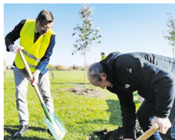
Sadzenie drzew w Sośnicy