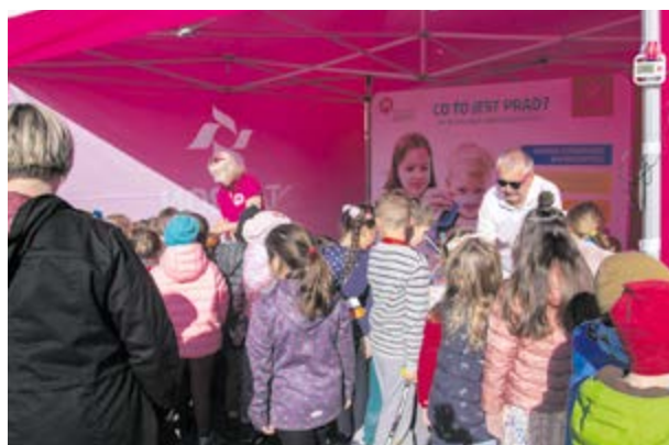
Chętnych na energetyczne doświadczenia nie brakowało