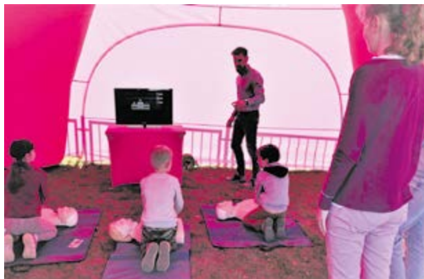
Ćwiczenia z zakresu pierwszej pomocy