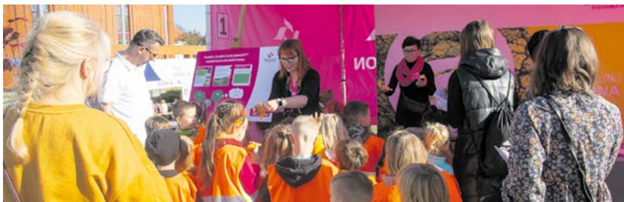
Nie zabrakło również quizów i konkursów