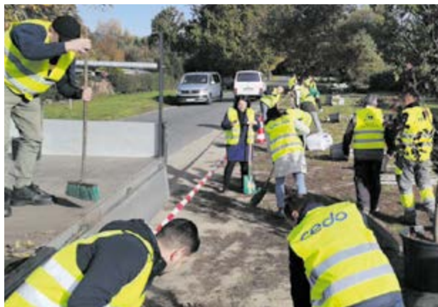
Sadzenia drzew w Kątach Wrocławskich z udziałem pracowników Cedo, Mount Park oraz Burmistrza

ALBA Group jest jednym z światowych liderów branży gospodarki odpadami i recyklingu, ochrony środowiska oraz handlu surowcami wtórnymi.