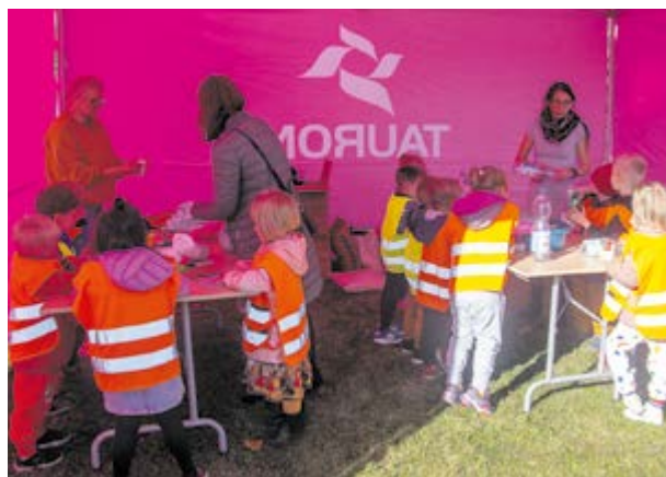
Warsztaty robienia ekologicznych karmników dla ptaków oraz lasu w stoiku