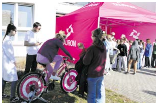
Chętni mogli zmierzyć swoją energię na specjalnym rowerze