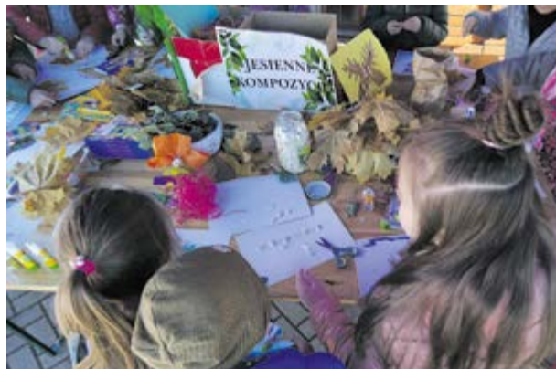
Ekologiczne prace plastyczne w wykonaniu dzieci