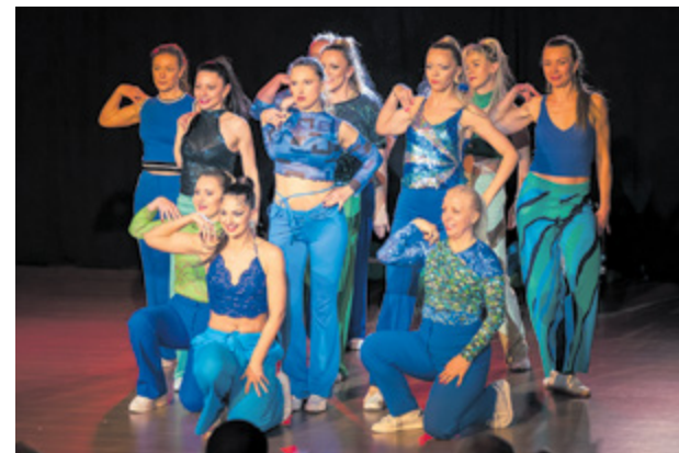
21. Spotkania taneczne