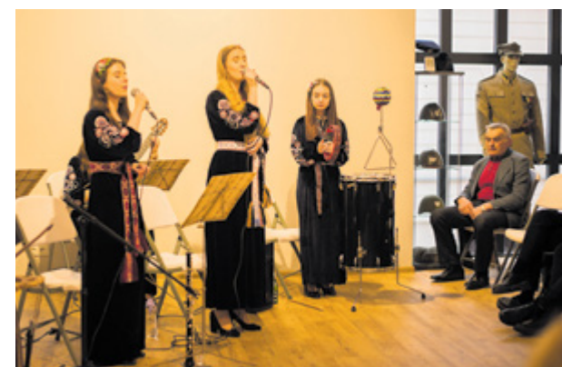
Kulturalny piątek z Zespołem Mokusza