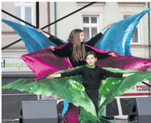
Koło Teatralne FELIX