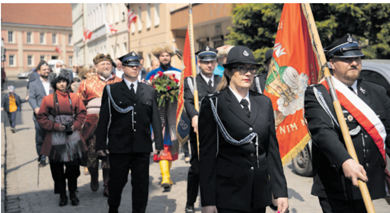
Uroczysty przemarsz na kącki Rynek