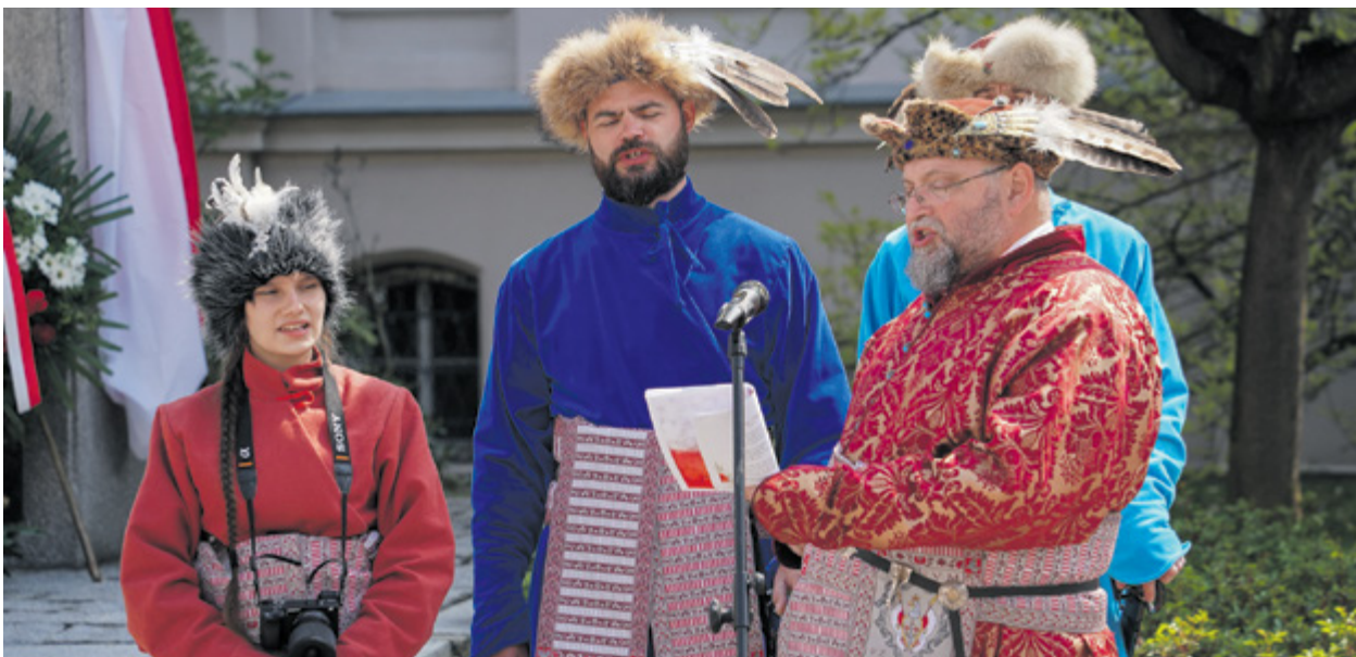
Wspólne śpiewanie pieśni patriotycznych pod przewodnictwem Klubu Signum Polonicum i przy akompaniamencie Orkiestry Dętej ze Smolca, fot. GOKiS