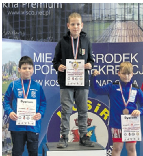
Złoty Antek.

Antek w walce finałowej w kategorii wagowej do 46 kg pokonał reprezentanta Zar, a na trzecim stopniu podium znaleźli się zawodnicy gospodarzy. Ciężka praca na treningach i wytrwałość poparta ogromnym talentem przyniosła piorunujące efekty. Gratulujemy wyników w tak prestiżowych zawodach.