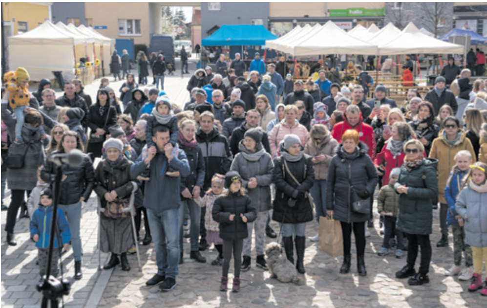
Jarmark Wielkanocny

W dniach 9-10 kwietnia 2022 r. w Kątach Wrocławskich odbył się Jarmark Wielkanocny. W strefie handlowej zaprezentowali się m.in. lokalni wytwórcy, Koła Gospodyń Wiejskich, a także nasi przyjaciele z Ukrainy. Nie mogło zabraknąć wspaniałych wypieków, wyrobów mięsnych, serów, miodów oraz wyjątkowego rękodzieła.