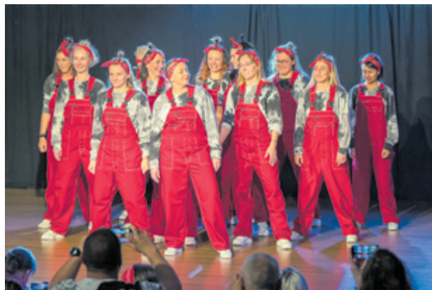
21. Spotkania taneczne

Wszystkim uczestnikom serdecznie dziękujemy za przybycie, fantastyczną atmosferę i taneczne prezentacje na najwyższym poziomie. Z niecierpliwością oczekujemy kolejnej edycji tanecznych zmagani!