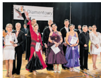
Laureaci Diamentowego Turnieju Tańca