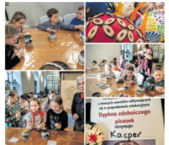
Wielkanocne Warsztaty w Regionalnej Izbie Pamięci

Warsztaty zgromadziły dzieci nie tylko z Polski, ale i z Ukrainy, dzięki czemu mogliśmy wzajemnie wymienić się wiedzą oraz dowiedzieć się, jak wygląda tradycyjne świętowanie w obu krajach i ile z tych dawnych zwyczajów przetrwało do dziś.