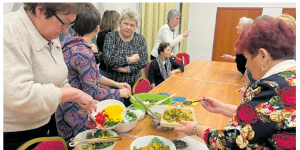
fol. Fundacja Kraina Inspiracji

Zadania realizowane były w ramach projektu grantowego LGD Lider A4, współfinansowanego ze środków Unii Europejskiej