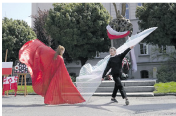
Występ uczennic z SP Sadków

Z inicjatywy mieszkańców biało-czerwone flagi zawisły również na ulicach Skałki. W ramach lokalnej akcji „Nasza Flaga” mieszkańcy wsi uszyli 40 flag Polski i zamontowali je na słupach latarni z okazji Święta 3 Maja. Uszycie flag sfinansowane zostało przez Gminę Kąty Wrocławskie oraz prywatnych sponsorów. Wykonane flagi będą wykorzystywane również podczas innych świąt narodowych m.in. 11 listopada. Zachęcamy do brania przykładu z mieszkańców Skałki i kontynuowania tak pięknych inicjatyw.