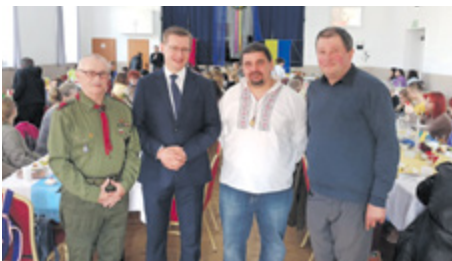
Polsko-ukraińskie spotkanie integracyjne

Mieszkańcy naszej gminy bardzo gościnnie przyjmują obywateli Ukrainy, którzy w wyniku działań wojennych przybyli na nasze tereny.