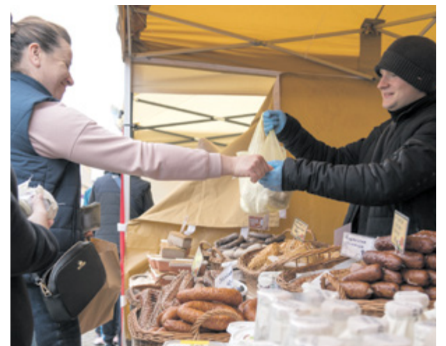
Jarmark Wielkanocny

Podczas jarmarku ogłoszone zostały również wyniki konkursu „Wielkanocne wypieki”. Nagrodę przyznawali także mieszkańcy, którzy mieli okazję skosztować konkursowych ciast. Podczas wspólnych gier i zabaw sprawdziliśmy rów-