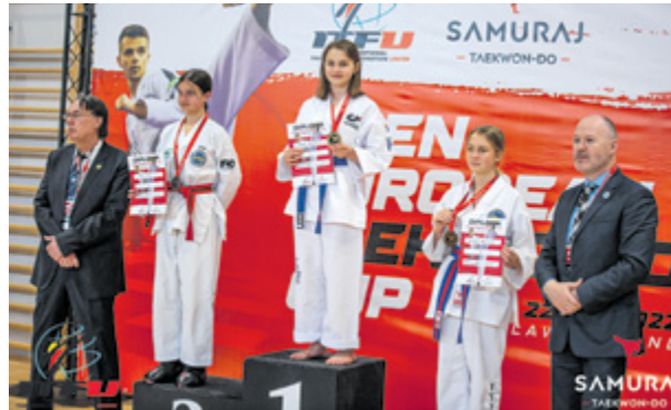
Brązowy medalista Pucharu Europy.