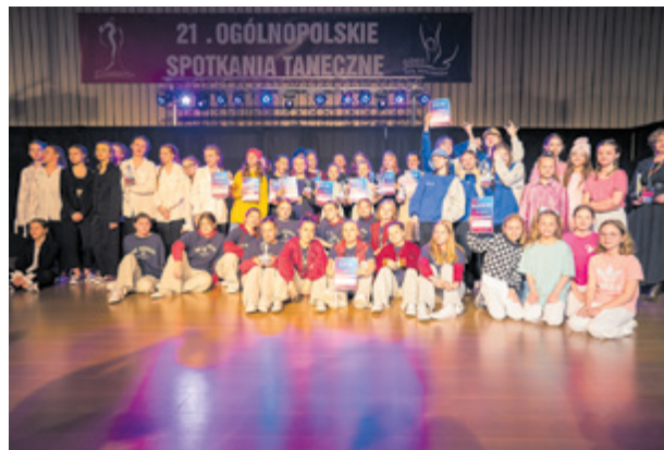
21. Spotkania taneczne