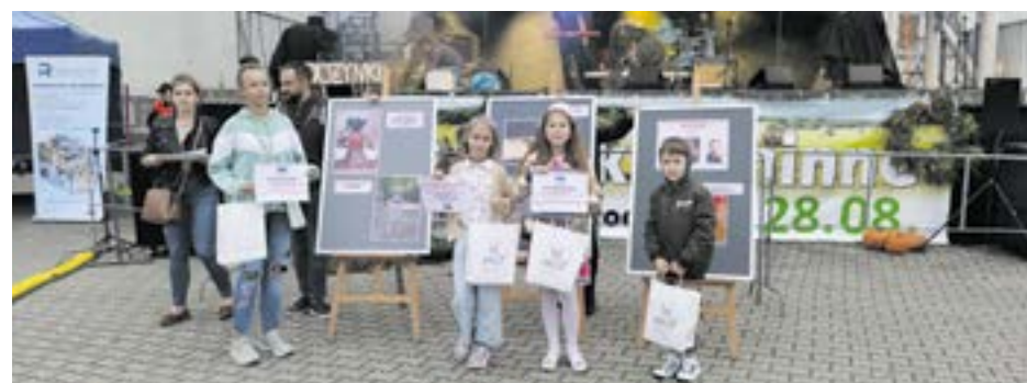
Laureaci I Letniego Konkursu Fotograficznego

Podczas tegorocznych Dożynek Gminnych nastąpiło wręczenie nagród dla zwycięzców I Letniego Konkursu Fotograficznego.