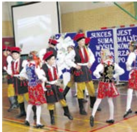
Występ zespołu Haneczka