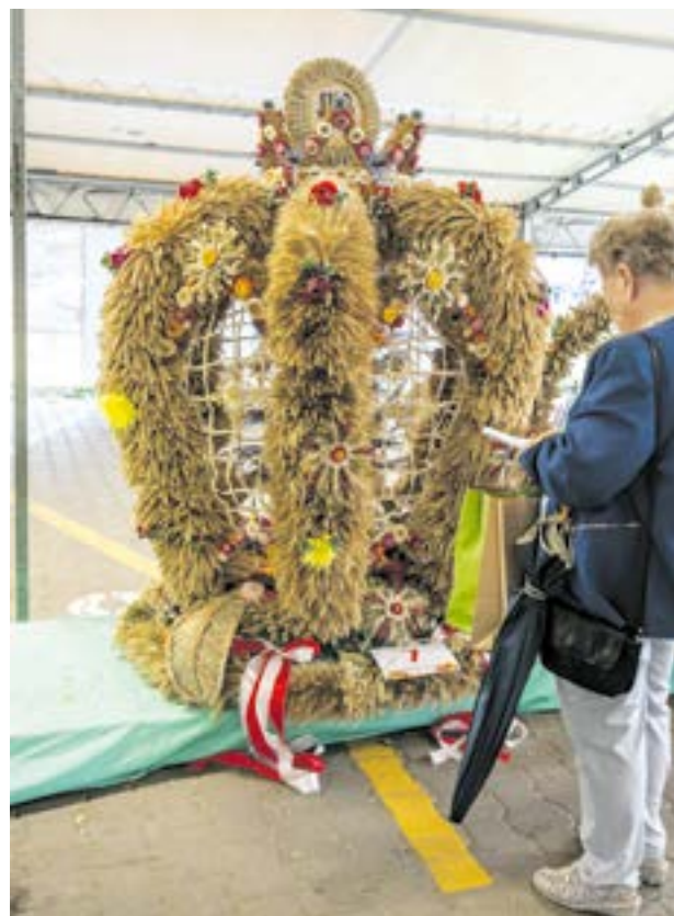
Tegoroczne wieńce dożynkowe prezentowały się niezwykle