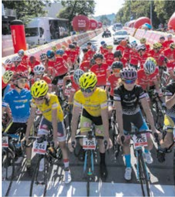
Tour de Pologne | fot. Piotr Łabaziewicz TdP Junior