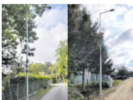
Nowe oświetlenie drogowe w Górzycach i Nowej Wsi Kąckiej

Niebawem pojawi się też nowe oświetlenie w innych miejscowościach gminy - trwają prace przy budowie oświetlenia drogowego w Mokronosie Dolnym na ul. Agrestowej i Gwieździstej oraz w Smolcu na ul. Ogrodowej. Wkrótce rozpocznie się również budowa oświetlenia w Czerńczykach na ul. Dębowej, w Kątach Wrocławskich na ul. Korczaka, przy skwerze im. Dr Teresy Bielez-Gniedziejko, na ul. Imbirowej oraz na ul. Lipowej przy skrzyżowaniu z ul. Mireckiego. Nowe oświetlenie planowane jest również w Sadkowie na ul. Gruszkowej, Pigkowej, Owocowej, Morelowej, Jarzębinowej