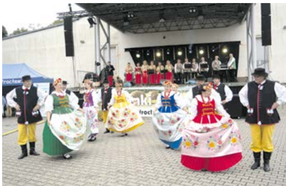
Występ zespołu tancerzonego Hanka