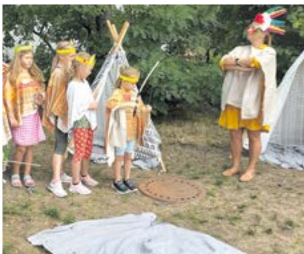
Baza Pocahontas | fot. GOKiS Smolec

Dzieci skorzystać mogły z tematycznych zajęć, które prowadzone były pod szyldem znanych i lubianych bajkowych postaci. Jako pierwsza pojawiła się najprawdziwsza Baza Pocahontas! Trzydzieścioro czerwonych twarzy rozbiło swoje tipi, własnoręcznie przyozdobiło pióropusze i przystąpiło do rywalizacji łuczniczej o tytuł Sokolego Oka. Następnie przyszedł czas na 30 młodych kamratów, którzy wzięli udział w czterogodzinnym rejsie statkiem dalekomorskim. By dopłynąć do wschodniego wybrzeża Afryki musieli się wykazać zręcznością i sprytem. Na całe szczęście znaleziony w butelce list przyczynił się do odnalezienia właściwej drogi do Bazy Sindbada. W ostatniej odsłonie dzieci mogły wybrać się w czterogodzinną podróż ze Smolca do afrykańskiej dżungli. Nie było łatwo odnaleźć się na czarnym lądzie – Smoleccy śmiałkowie musieli stawić czoła m.in. atakom małp rzucających cytrynami! Młodzi podróżnicy z pomocą pani przewodnik i kolorowych papug z łatwością odnaleźli schronienie – bazę Tarzana! A tam już tylko uroki tropikalnego życia!