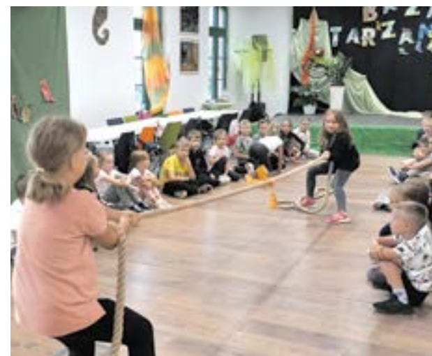
Baza Tarzana