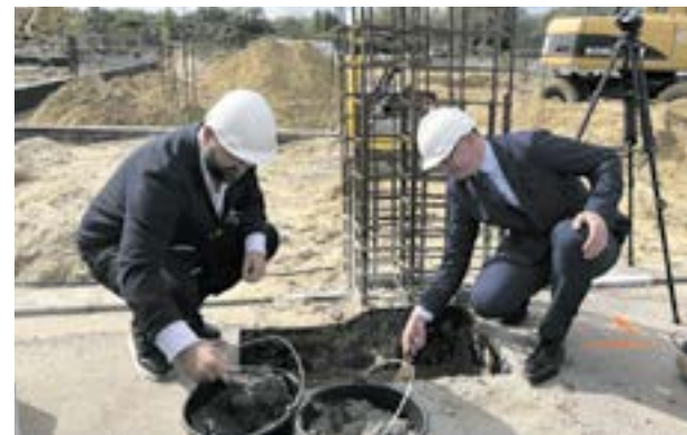
Wmurowanie kamienia węgielnego

Aktualnie trwają prace budowlane obejmujące wykonanie dalszej części fundamentów tj. murowanie ścian fundamentowych z bloczków betonowych oraz wykonywana jest izolacja pionowa. W innej części budynku stawiane jest deskowanie i zbrojenie ścian fundamen-