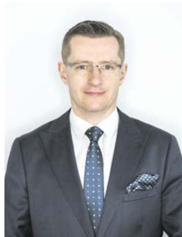
Burmistrz Miasta i Gminy Kąty Wrocławskie

Kończy się okres wakacyjnej beztrąski, który pożegnaliśmy gminnymi dożynkami, a relację z nich możecie Państwo przeczytać na łamach biuletynu. Zaczyna się czas intensywnej pracy, nie tylko w szkołach, ale i w gminie. Już wkrótce rozpoczniemy prace nad przyszłorocznym budżetem, który w dużej mierze kreuje przyszłość naszej gminy. Będzie to budżet niezwykle trudny, wymagający rozważnych decyzji i skrupulatnych kalkulacji. Długi okres pandemii oraz skomplikowane okoliczności międzynarodowe mocno odbiły się również na sytuacji makroekonomicznej Polski. Rosnące ceny i podnoszone stopy procentowe to czynniki, które odczuwamy zarówno w domowych portfelach, jak i w gminnym budżecie. Są to bez wątpienia trudności, z którymi musimy się zmierzyć w najbliższym czasie. Jestem jednak przekonany, że uda się wypracować rozwiązania, które pozwolą nam w bezpieczny sposób realizować zaplanowane inwestycje i nadal skutecznie kontynuować rozwój naszej gminy.