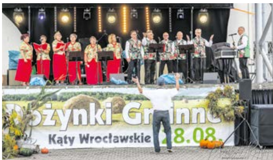
Przeгляд zespołów ludowych Folkąty