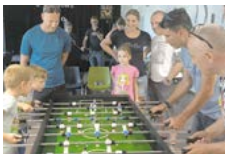
I Smoleckie Mistrzostwa w Piłkarzykach Stołowych | fot. GOKiS Smolec

Mistrzowski poziom został utrzymany, a na podium znalazły się drużyny: GUCIE, FC WSPOMNIENIE, MAREK&AREK