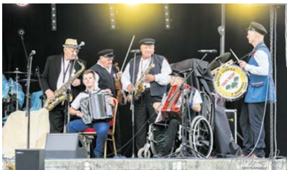
Przeгляд zespołów ludowych Folkąty