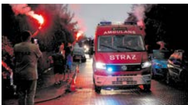
Powitanie nowego wozu ratowniczo-gaśniczego

Atrakcją wieczoru był bez wątpienia nowy samochód ratowniczo-gaśniczy marki Scania P370 XT zabudowany przez Szczęśniak Pojazdy Specjalne. Ten nowoczesny,