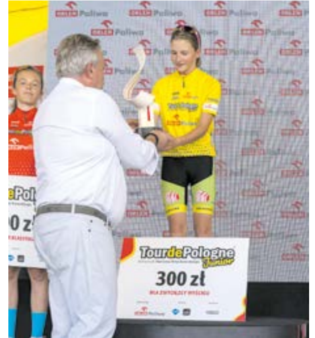
Tour de Pologne | fot. Piotr Łabaziewicz TdP Junior