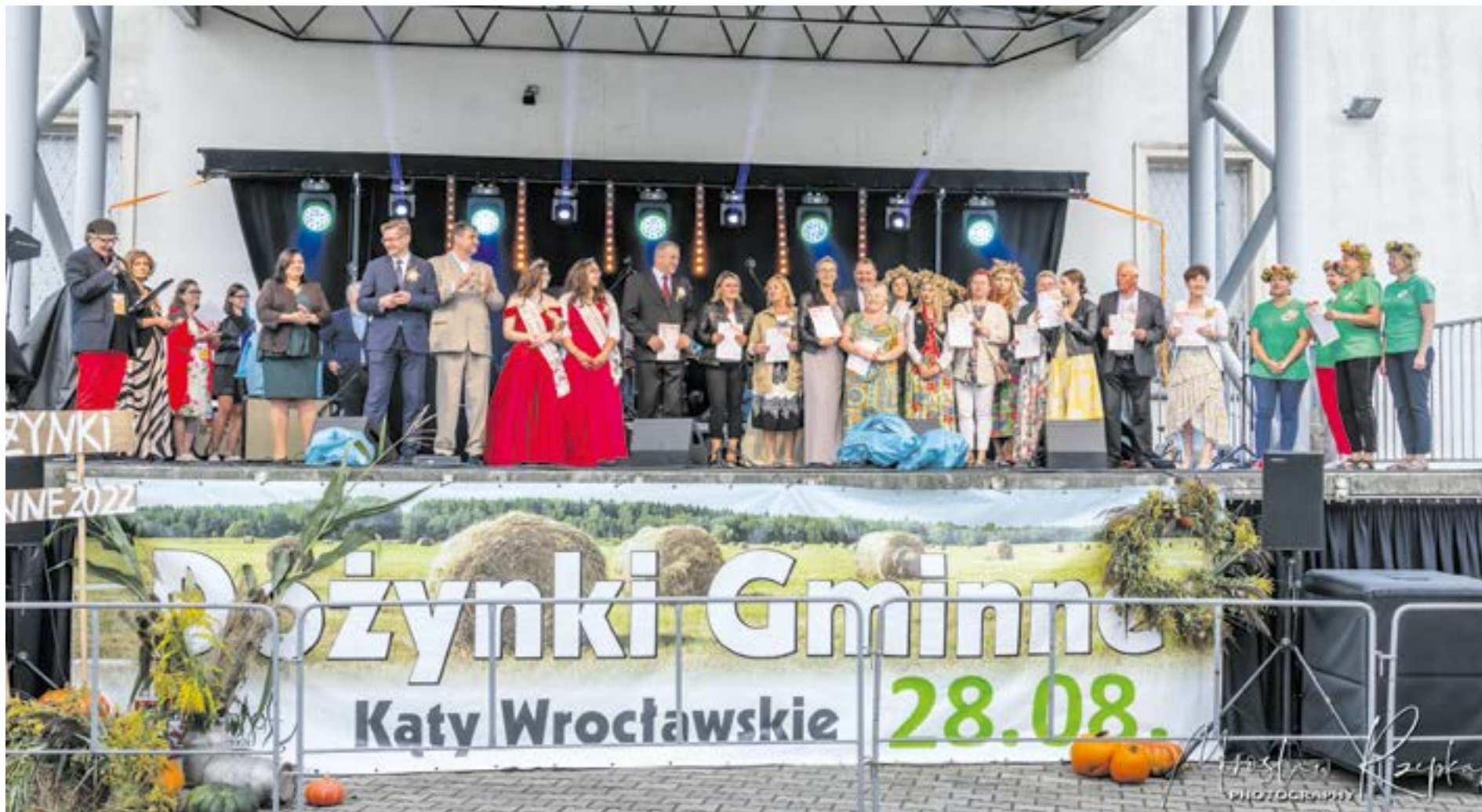
Zwycięzcy konkursu na największy wieniec i kosz dożynkowy

Rekordowe zainteresowanie mieszkańców, kolorowe, ludowe stroje, misternie zdobione wieńce i kosze dożynkowe oraz prawdziwe show w wykonaniu Cleo – tak podsumować można Święto Plonów w Kątach Wrocławskich. Przypieczętowaniem tegorocznych dożynek był sukces Sołectwa Romnów i zdobyty tytuł „Najpiękniejszego Tradycyjnego Wieńca Dożynkowego Powiatu Wrocławskiego”.