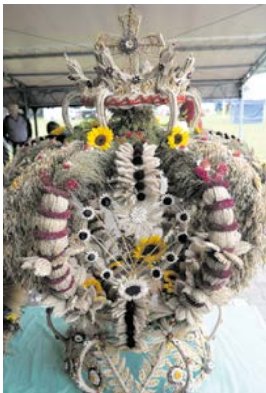
Wieniec Sołectwa Romnow z podwójnym tytułem - najpiękniejszego wieńca w konkursie gminnym oraz powiatowym