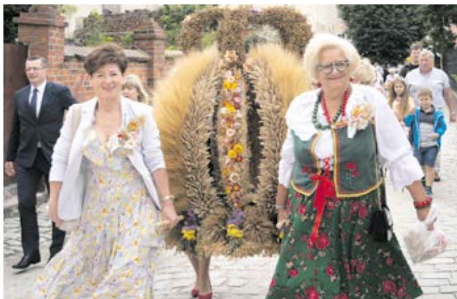
Korowód z wieńcami i koszami dożynkowymi przeszedł ulicami miasta