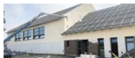
Budynek pełnowymiarowej sali gimnastycznej

W ramach realizacji inwestycji do użytku uczniów oddany zostanie obiekt o powierzchni użytkowej 532,32 m 2 . Budynek został zaprojektowany jako niepodpiwniczony o jednej kondygnacji w technologii tradycyjnej murowanej z dachem krytym blachą dachówkopodobną. W nowo budowanym obiekcie znajdować się będą: sala