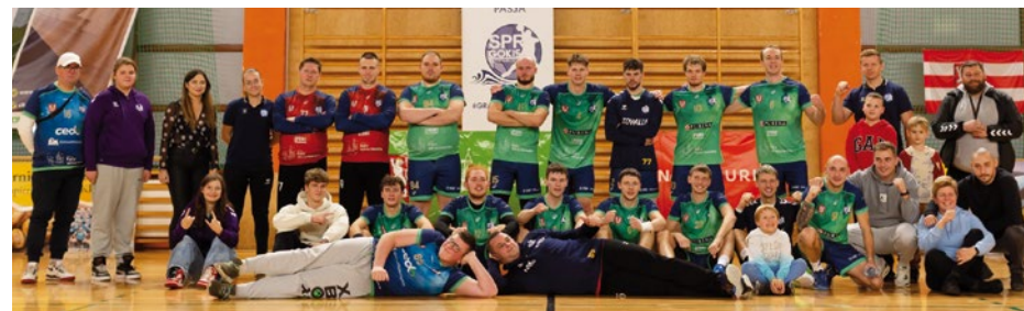
Seniorzy z SPR Purina Kąty Wrocławskie

Na Hali Widowiskowo-Sportowej w Kątach Wrocławskich odbył się emocjonujący mecz, w którym piłkarze z SPR Purina Kąty Wrocławskie zmierzyli się z UKS Spartakus Buk. Nasza drużyna odniosła spektakularne zwycięstwo, wygrywając 45:24. Kibice mogli poczuć niesamowite emocje i podziwiać świetną grę naszych zawodników. Gratulujemy drużynie i czekamy na kolejne sukcesy!