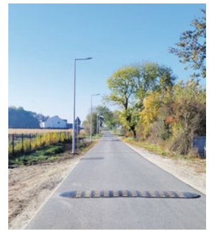
Nowe oświetlenie w Mokronosie Dolnym

W październiku zakończone zostały prace związane budową oświetlenia drogowego w Mokronosie Górnym. 16 lamp zamontowanych zostało przy ulicy Spacerowej, które oświetlą odcinek drogi o długości 425 mb.