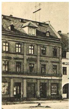
Rynek 30 w latach 1900-1920