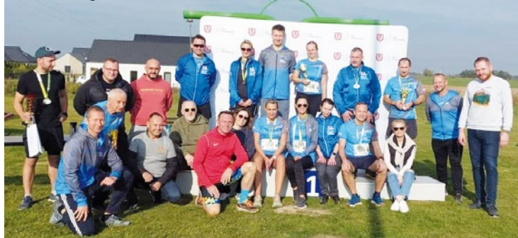
Uczestnicy Biegu o Puchar Burmistrza

waniu biegaczy wydarzenie przebiegło w doskonałej atmosferze. W dystansie 5 i 10 km wzięli udział zarówno zawodnicy indywidualni, jak i drużyny, które dały pokaz sportowego ducha walki. Zwieńczeniem całego wydarzenia była uroczysta de-