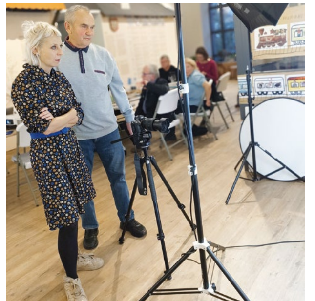
Foto warsztaty w Regionalnej Izbie Pamięci