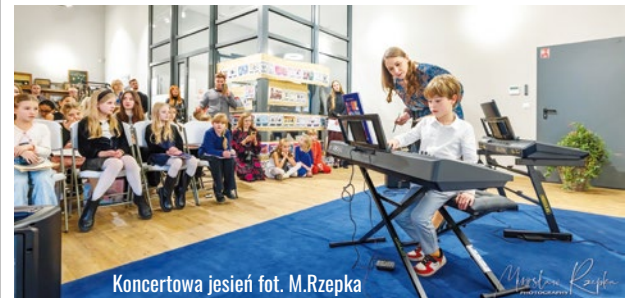
Koncertowa jesień

Już niebawem zobaczymy się, podczas kolejnego koncertu - tym razem w klimacie świąt Bożego Narodzenia. MK, Regionalna Izba Pamięci