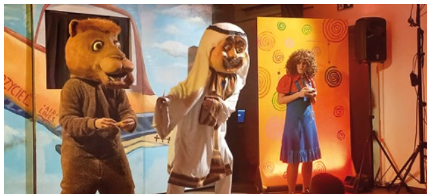
Magnicella Magik, Maks i kompas w Smolcu

27 października GOKiS Smolec zamienił się w magiczny teatr, w którym najmłodszy widowie przeniesli się do świata