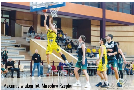
Maximus w akcji