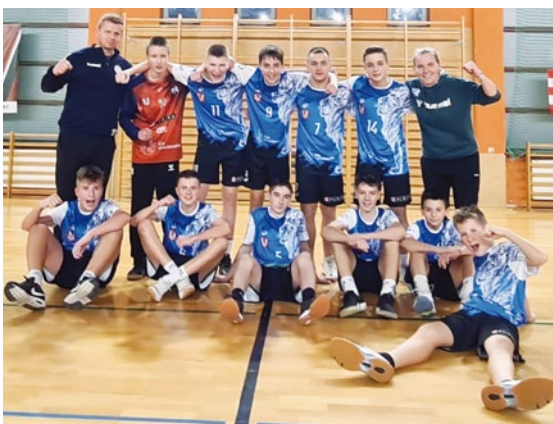
Młodzicy z SPR Purina Kąty Wrocławskie

7 listopada na Hali Widowiskowo-Sportowej w Kątach Wrocławskich nasi młodzicy SPR Purina Kąty Wrocławskie odnieśli wspaniałe zwycięstwo. W wymagającym meczu pokonali drużynę Śląsk Wrocław Handball Akademia z wynikiem 41:38. Emocje na trybunach sięgały zenitu, a walka trwała do ostatnich minut, dostarczając kibicom niezapomnianych wrażeń. Dziękujemy wszystkim, którzy przyszli wspierać piłkarzy i serdecznie zapraszamy na kolejne mecze – razem tworzymy sportowe emocje!