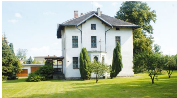
Willa przy ul. Dworcowej