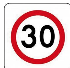
Strefa ograniczonej prędkości

innych niż wyznaczone znakami drogowymi. Celem tego zabiegu było zarówno uspokojenie ruchu pojazdów w zabytkowej części miasta oraz umożliwienie pieszym i rowerzystom korzystanie w bezpieczny sposób z uroków otoczenia Rynku Staromiejskiego.