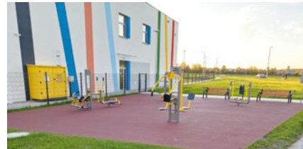
Ogólnodostępna siłownia w Krzeptowie

Oddana do użytku została ogólnodostępna siłownia terenowa w Krzeptowie. Inwestycja została zaprojektowana i wykonana w bezpośrednim sąsiedztwie nowo wybudowanego obiektu Zespołu Szkolno – Przedszkolnego w Krzeptowie, przy ciągu pieszo – rowerowym łączącym ul. Wiśniową w Smolcu z Krzeptowem.