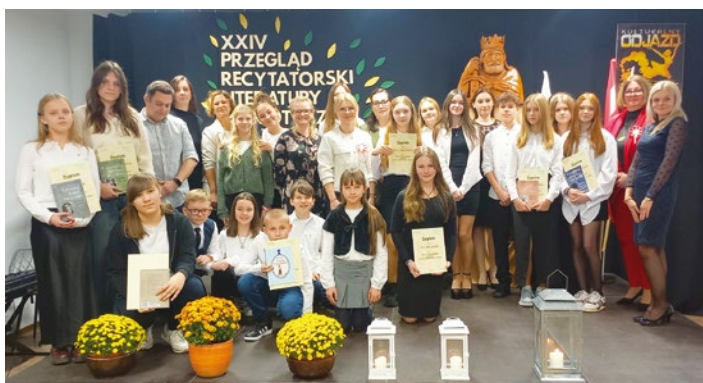
11 listopada w interpretacji uczniów

W atmosferze patriotyzmu i głębokiej refleksji odbył się XXIV Przegląd Literatury Patriotycznej i Religijnej, zorganizowany przez Szkołę Podstawową w Małkowicach 8 listopada w GOKiS w Smolcu. Wydarzenie było częścią obchodów Narodowego Święta Niepodległości, a zgromadzona publiczność miała okazję wysłuchać 17 wzruszających występów, które wprowadziły w nastrój pamięci o historii, wartościach narodowych i religijnych. W przeglądzie wzięli udział utalentowani uczniowie z pięciu szkół naszej gminy – z Kątów Wrocławskich, Gniechowic, Smolca, Sadowka oraz Małkowic – którzy poprzez recytacje i poezję śpiewaną oddali hołd niepodległościowej tradycji. Młodzi artyści zaprezentowali m.in. utwory takich autorów jak Czesław Miłosz, Kazimierz Wierzyński, Witold Gombrowicz, Melchior Wańkowicz i Marek Hłasko. Ich wykonania nie były tylko piękno literatury, ale również głębokie przesłania o odwadze, wolności i wierze.