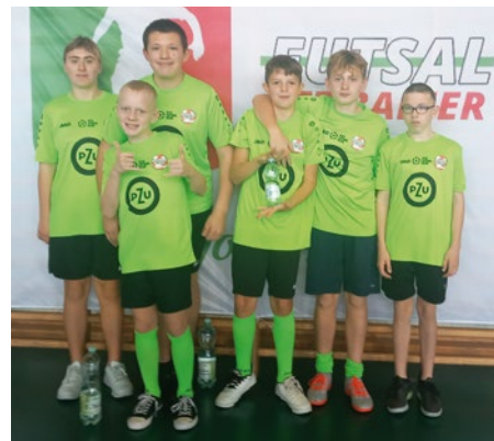
Drużyna Akademii GOKiS Kąty Wrocławskie

6 listopada 2024 roku zawodnicy Akademii GOKiS Kąty Wrocławskie wzięli udział w turnieju „Futsal Bez Barrier”, który odbył się w hali sportowej w Dobroszycach. To wyjątkowe rozgrywki, stworzone z myślą o osobach z niepełnosprawnościami, podczas których liczy się duch sportowej rywalizacji i integracja. Do zawodów przystąpiły drużyny z wielu miejscowości, m.in. Wrocławia, Milicza, Opolnicy, Szarocina, Dobroszyc, Oławy, Trzebnicy oraz Kątów Wrocławskich. Dla naszych zawodników był to kolejny krok w zdobywaniu cennego doświadczenia i rozwijania umiejętności na boisku.