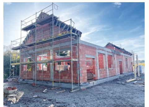
Budowa świetlicy w Krzeptowie

W ramach budowy świetlicy wiejskiej w Krzeptowie wybudowano już wszystkie ściany konstrukcyjne wraz ze ścianami szczytowymi. Wykonane zostało również zbrojenie wieńców i trwa przygotowanie do ich zabetonowania. Ponadto trwa murowanie ścian działowych. Zadanie obejmuje budowę 1-kondygnacyjnego budynku o powierzchni 173 m 2 . Podział budynku uwzględnia pomieszczenia takie jak wiatrołap, korytarz, szatnie, sanitariaty, podgrzewalnię posiłków, magazyn środków spożywczych, salę zajęć, salę główną, pomieszczenia gospodarcze i techniczne. Budynek zostanie wyposażony w instalację: wodno-kanalizacyjną, wentylacji, centralnego ogrzewania ze źródłem ciepła w postaci pompy ciepła o mocy 28kW, od-