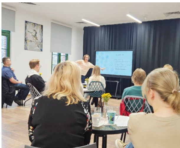
GOKiS Smolec dba o spokojne głowy mieszkańców

10 listopada w Smolcu odbyło się drugie spotkanie z cyklu warsztatów „Spokojna głowa”, które tym razem skupiło się na „naprawianiu myślowych usterek”. Zajęcia poświęcone były rozpoznawaniu i eliminacji negatywnych automatycznych myśli, które mogą wpływać na nasze samopoczucie i postrzeganie rzeczywistości. W trakcie warsztatów uczestnicy poznawali praktyczne techniki neurofitnessu, pozwalające na wyciszenie umysłu oraz redukcję napięcia w ciele. Pod okiem specjalistów, którzy poprowadzili warsztaty, uczestnicy zgłębiali mechanizmy działania własnego umysłu, by skuteczniej rozpoznawać i neutralizować szkodliwe schematy myślowe. Spotkanie to stanowiło okazję do refleksji nad własnym zdrowiem psychicznym oraz dawało narzędzia, które można wykorzystać na co dzień, by lepiej radzić sobie ze stresem i emocjami.