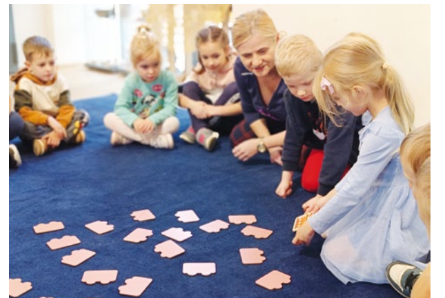
Przedszkolaki z historią kolei