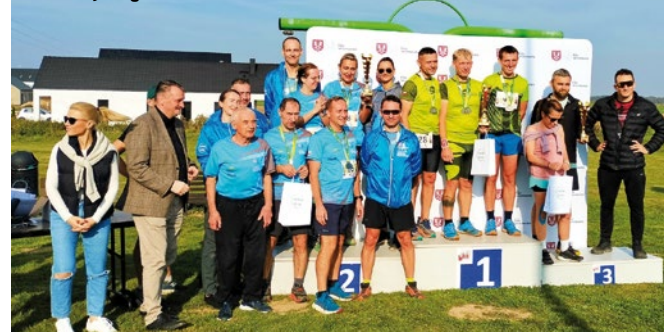
Uczestnicy Biegu o Puchar Burmistrza

waniu biegaczy wydarzenie przebiegło w doskonałej atmosferze. W dystansie 5 i 10 km wzięli udział zarówno zawodnicy indywidualni, jak i drużyny, które dały pokaz sportowego ducha walki. Zwieńczeniem całego wydarzenia była uroczysta de-