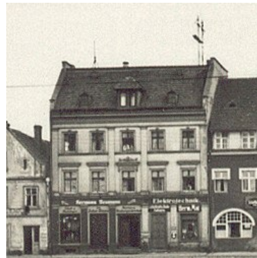
Rynek 30 w latach 30

szym urzędniku pocztowym. Była to więc z pewnością kamienica należąca do ówczesnej kątckiej klasy średniej. Julius Gappe być może zajmował drugi lokal handlowy na parterze. Prowadził manufakturę i sklep z artykułami męskimi. Było to zapewne intratne zajęcie, gdyż był też właścicielem jednego z największych sklepów na naszym rynku, prowadzonego przez Hermanna Neumanna.