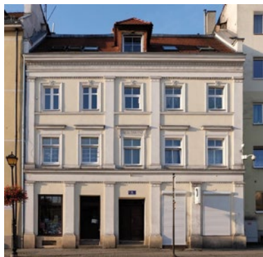
Rynek 30 w 2015