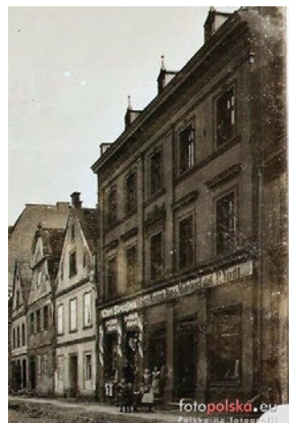
Rynek 30 w latach 1900-1910

Kamienica nr 30 (dawniej numer 32) w Kątach Wrocławskich ocalała z wojennej zawieruchy praktycznie bez szwanku. Miała więcej szczęścia niż sąsiadki z obu stron, rozebrane bez pardonu po wojnie. Niewielka tylko przebudowa dachu pozwala bez trudu rozpoznać ją na zdjęciu. Zbudowano ją w 2 połowie XIX wieku. Po wojnie zmieniała się kolorystyka, od piaskowego po róż oraz szczegóły architektoniczne dachu.