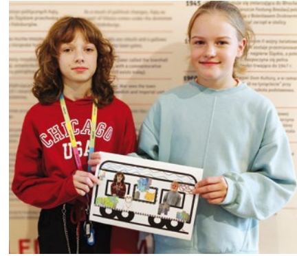
Historia kolei oczami uczniów

29 października 1843 roku Canth-Kąty Wr. otrzymały połączenie koleją żelazną. Znaleźliśmy się na trasie z Wrocławia do Świebodzic. Otworzyły się przed nami lepsze możliwości transportu między innymi pól rolnych z naszego terenu. Dostawy węgla i innych półproduktów stały się szybsze. Naturalnie na początku nie wszystkie transporty przejęła kolej. Powstała sytuacja była już sygnałem, że wraz z postępowaniem w nowo-wytworzeniu rozwiązań kolejowych, dojdzie do tego w niedalekiej przyszłości.