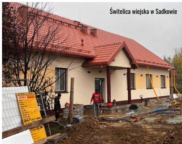
Świetlica wiejska w Sadkowie

W ramach zadania zostanie zakupione także wyposażenie, w tym sprzęt do kuchni m.in.: stoły, zlew, chłodziarko-zamrażarka, zmywarko-wyparzikarka oraz wyposażenie kuchenne takie m.in. jak: garnki, miski, serwis obiadowo – kawowy, komplety sztućców, podgrzewacz gastronomiczny, wózek kelnerski, kociołek elektryczny. Dodatkowo ubikacje zostaną wyposażone w lustra, wieszaki, dozowniki na płyn do mycia rąk, papier toaletowy, ręczniki papierowe. Zostaną także zakupione stoły bankietowe wraz z krzesłami.