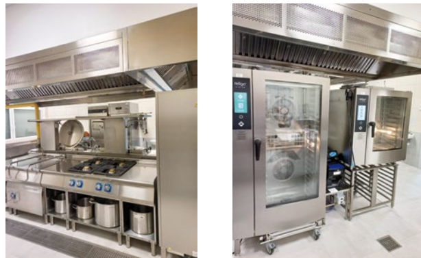
Blok kuchenny w kuchni w Krzeptowie

Obecnie wszystkie dzieci przedszkolne oraz z klas „0” w liczbie 186, korzystają z posiłków w placówce. Natomiast dzieci i młodzież szkolna w liczbie 370, także korzystają z posiłków w szkole, co stanowi niemal 60% całej liczby uczniów.