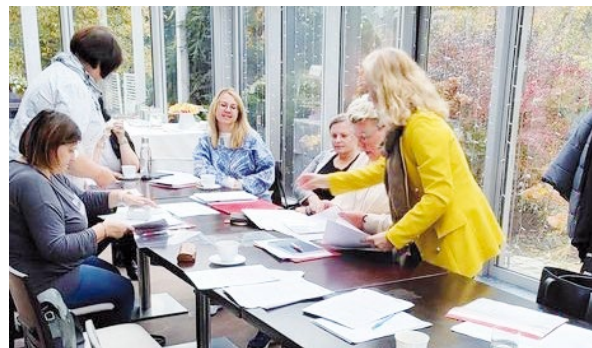
Wspólne szkolenie w usługach społecznych Gminy Kąty Wr. oraz Gminy Sobótka

Całkowita wartość projektu: 3 998 101,50 zł Wysokość wkładu z Funduszy Europejskich: 3 798 195,50 zł Wysokość wkładu własnego Gminy Kąty Wrocławskie: 99 953,00 zł Wysokość wkładu własnego Gminy Sobótka: 99 953,00 zł