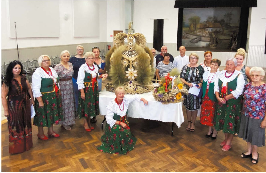
Zwycięski wieńiec (Zachowice)

Ze względu na sytuację epidemiczną w tym roku zrezygnowano z organizacji gminnego święta plonów w gminie Kąty Wrocławskie. Organizatorzy nie rezygnowali z kultywowania tradycji wicia wieńców i koszy.