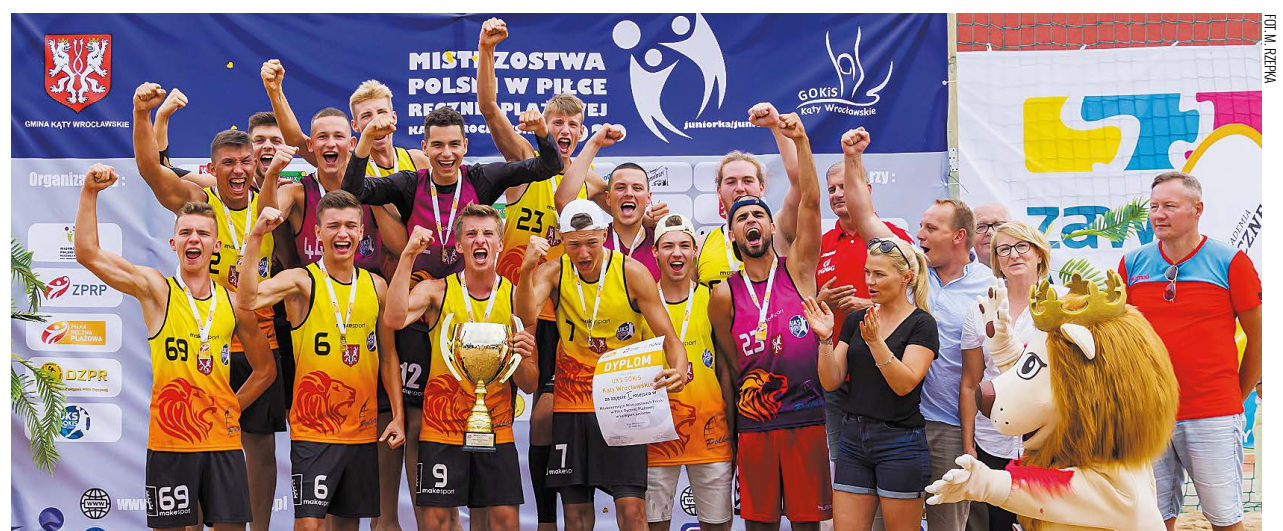
Zwycięzca mistrzostw w kategorii juniorów UKS GOKiS Kąty Wrocławskie