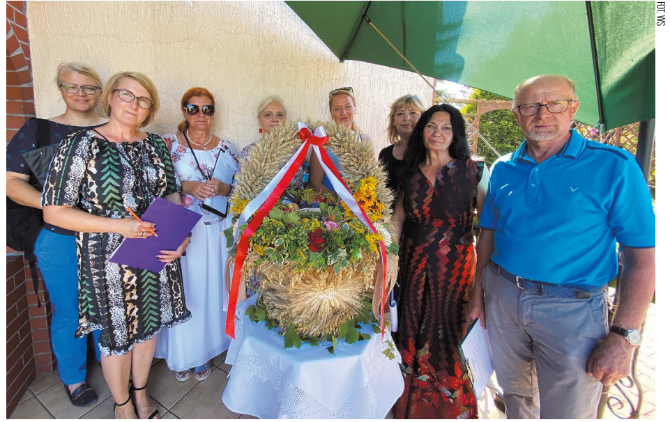
Zwycięski kosz (Nowa Wieś Wrocławska)

Rok 2020 jest szczególnym czasem, w którym plany wydażeń rewiduje trwająca pandemia koronawirusa. Tradycją w gminie jest organizacja Dożynek podczas których wspólnie świętujemy i dziękujemy za zebrane plony. Pandemia nie zwolniła rolników z ich ciężkiej pracy, wywiązali się z niej w pełni i mimo zagrożenia zapewniają dla nas bezpieczeństwo żywnościowe. Z uwagi na konieczność przestrzegania rygorów sanitarnych, aby nie narażać mieszkańców na niebezpieczeństwo, podjęto decyzję, że w tym szczególnym czasie dożynki w tradycyjnej formie nie będą organizowane. Zorganizowano konkurs na wieńce i kosze dożynkowe. Wśród celów konkursu należy wymienić: upowszechnienie i kultywowanie tradycji regionalnej związanej z okresem żniw, pre-