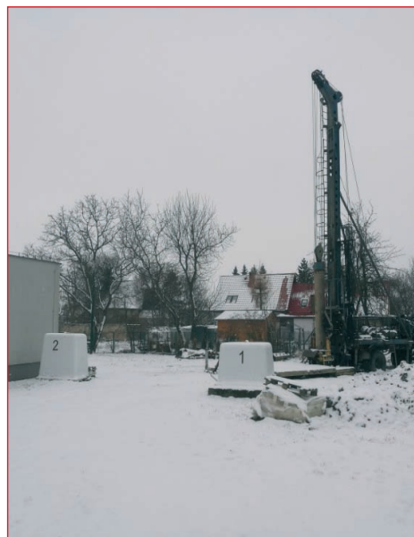
Zdjęcie wiertnicy w Stacji Uzdatniania Wody w Sadkowie

Zakład Gospodarki Komunalnej sp. z o.o. eksploatuje 7 Stacji Uzdatniania Wody. Dziennie dostarczają ok. 4 000 m 3 wody do domów i obiektów produkcyjnych zlokalizowanych w obrębie gminy. Obiekty wodociągowe są zarządzane poprzez system monitoringu i sterowania, który od roku 2010 jest rozbudowywany. Na bieżąco monitorowane są parametry dotyczące między innymi ciśnienia, przepływu, poziomów zwierciadła wody w studniach głębinowych, poziomu wody w zbiorniku wody czystej. Dane pozyskiwane z systemu pozwalają na szybkie usuwanie wszelkich zakłóceń w dystrybucji wody. Istniejące studnie wybudowane w latach 70. są w znacznym stopniu wyeksploato-