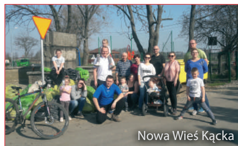
Nowa Wieś Kącka