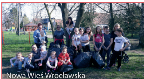
Nowa Wieś Wrocławska