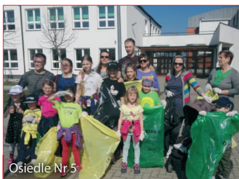
Osiedle Nr 5