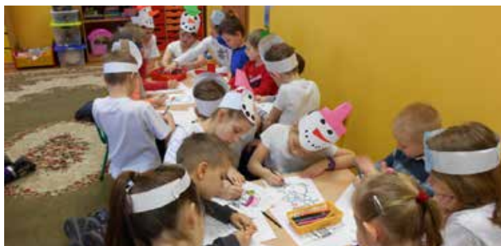
Zespół ds. Promocji Szkoły

Uczniowie z kółka teatralno-literackiego ze Szkoły Podstawowej nr 1 w Kątach Wrocławskich odwiedzili dzieci z Przedszkola Sióstr Elżbietanek. Wizyta związana była z realizacją projektu czytelniczego. Przedszkolaki z grupy „Zabki” wysłuchali wierszyków o bałwankach, śnieżynkach i niedźwiadkach polarnych. Dzieci wesoło reagowały na występ. Na zakończenie spotkania, kolorując bałwanki, dzieci wykonały wspólne prace plastyczne.