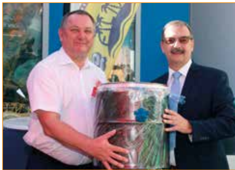
Wspólne zdjęcie burmistrzów Biblis i Kątów Wrocławskich podczas akademii z okazji 15-lecia partnerstwa pomiędzy naszymi gminami.

W tym roku grupa z Polski liczyła 13 osób, oprócz osób związanych z urzędem Miasta i Gminy Kąty