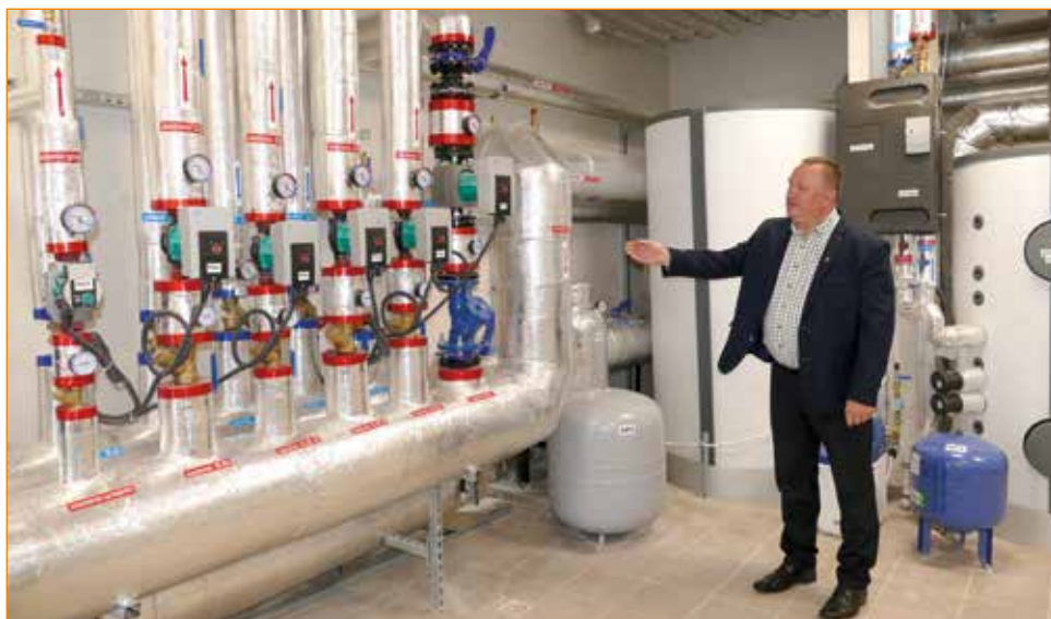
Kotłownia w szkole w Sadowie