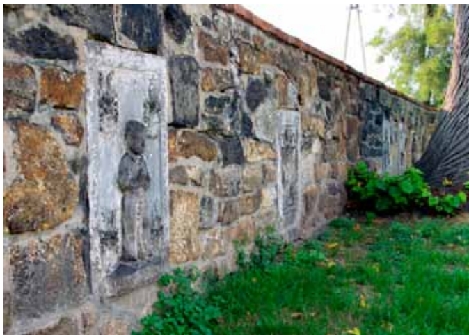
Zachowice - mur kościelny z płytami nagrobnymi