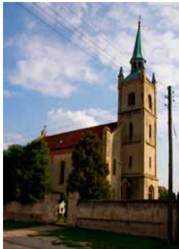
■ Nowa Wieś Kącka - kościół

chód od niej, istniał wiatrak typu koźlak (wspomniany już w 1845 r. - istniał jeszcze w 1939 r., napędzany siłą wiatru i zwierząt po-