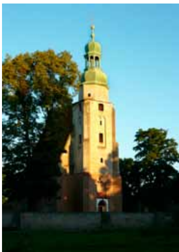
Małkowice - kościół

miejscu wcześniejszego obiektu wzmiankowanego w 1287 r. Świątynia w stylu gotyckim, jest typowym kościołem parafialnym z tamtego okresu - jednonawowy z wydłużonym, trójbocznie zakończonym prezbiterium. Dach dwuspadowy, nad prezbiterium - pięciospadowy, wieża z hełmem barokowym. Wewnątrz sklepienia krzyżowo-żebrowe, z gotyckimi zwornikami w prezbiterium. Ołtarz główny barokowy, powstał podczas częściowej przebudowy w 1680 r. - centralną część zajmuje marmurowa rzeźba