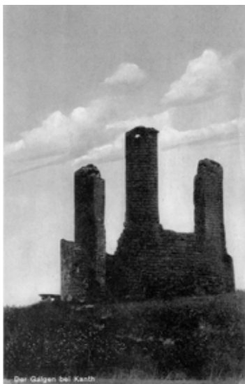
■ Kąty Wrocławskie - szubienica w 1942 r.

Miasta i wszyscy mieszkańcy żeby obejrzeć egzekucję, okazało się, że zapomniano sznura. Postanowiono wysłać do miasta po powrót samego skazańca. Jakież musiało być zdziwienie, gdy po wielu godzinach oczekiwania na złoczyńcę, ten nie powrócił i nigdy już w Kątach się nie pojawił. Na początku XIX wieku przeprowadzono remont obiektu z wykorzystaniem cegły z rozbieranych w tym czasie murów miejskich. Od tamtej pory nie wykonano z pewnością żadnych wyroków, a w latach 50-tych XX wieku szubienicę rozebrano.