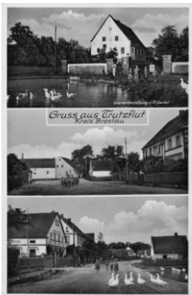
■ Sokolniki - pocztówka z pocz. XX w.

Dom mieszkalny nr 11 z 1848 r. (data nad wejściem zapisana cyframi rzymskimi: MDCCCXLVIII, z inicjałami U.K.E. oraz domalowanymi później cyframi 48, na zapisie rzymskim). Budynek murowany, piętrowy, ustawiony szczytowo, z dachem dwuspadowym (pierwotnie z lukarnami). Część otworów okiennych zmieniono. W części centralnej wejście i portal z łukiem koszowym, ujęty parami pilastrów, podobnie krawędzie ścian zdobią pilastry. Do domu przylega budynek gospodarczy. Obora naprzeciwko budynku mieszkalnego, szczytowo ustawiona do ulicy, z końca XIX wieku. Murowana, sklepienie na słupach kamiennych, część otworów okiennych z łukiem odcinkowym w obramowaniu ceglany. Obok magazyn z bramą zakończoną łukiem odcinkowym, obecnie z wrotami przesuwными. W głębi podwórza stodoła z przełomu XIX i XX wieku, z dachem dwuspadowym, murowana, otynkowana, z parą wrót na przestrzał. Tego typu układy zabudowań są charakterystyczne dla większości gospodarstw w Sokolnikach.