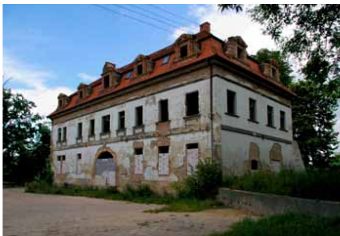
■ Gniechowice - pałac

We wnętrzu obecnie brak wyposażenia. Wiadomo, że w północno-zachodniej części rezydencji, na piętrze, znajdował się kominek z XVIII wieku. Pomieszczenia kondygnacji dekorowały stiuki i malowidła - nie zachowały się do dziś w pierwotnym stanie.