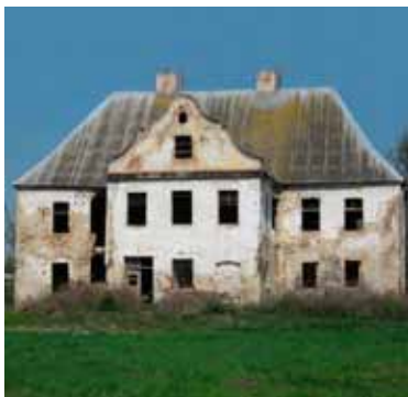
■ Górzycy - pałac