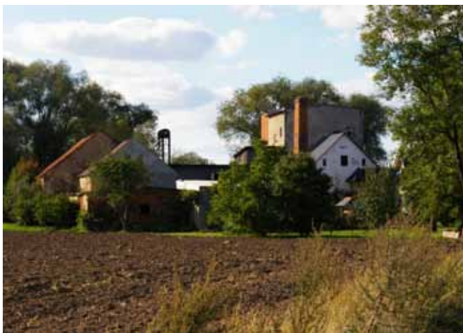
■ Kozłów - zabudowania młyna

Młyn tzw. Nowy - Neumühle położony na północny zachód od wioski, przy rzece Strzegomce, czynny jest do dziś - pierwotnie wodny, obecnie elektryczny. Wzmiankowany przez F. A. Zimmer-