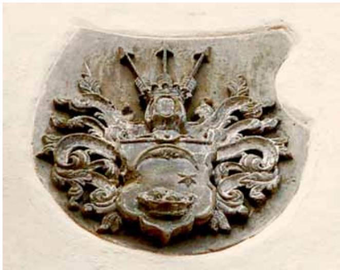
Baranowice - herb na elewacji frontowej pałacu

1683 r. - Bara. Do 1939 roku funkcjonowała nazwa Baara, którą przekształcono na Bahra.