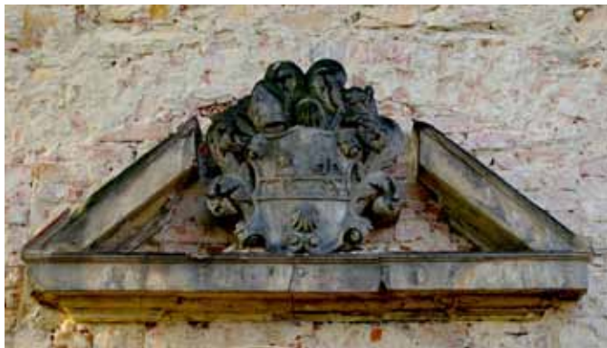
■ Pełcznica - naczółek nad wejściem domu nr 26

Na początku wsi, jadąc od strony Kątów Wrocławskich, znajduje się budynek dawnego klasztoru św. Józefa z 1867 r. (dom nr 5), rozbudowany w XX wieku, piętrowy, z poddaszem, na wysokim przyziemiu, ustawiony kalenicowo. Ryzalit z facjatą, przekrytą dachem dwuspadowym - poprzedzony gankiem murowanym. Wejście od podwórza przez ganek, budynek przykryty dachem naczółkowym ze świetlikami. Elewację dzieliły gzyms wieńczący i podokapowy- niezachowane. Od frontu również ryzalit z facjatą i dachem dwuspadowym. W szczycie dwa okna zakończone łukowo i wyżej okulus. W latach 80-tych XX w. budynek był jeszcze własnością klasztoru sióstr elżbietanek. Obecnie dom mieszkalny.