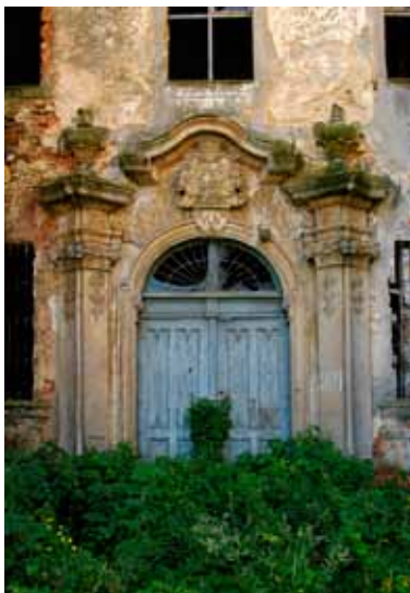
■ Chybczyce - portal wejściowy pałacu

Przed pałacem znajdował się dziedziniec podjazdowy z platanami i rzezbami kamiennymi - m. in. personifikacją czterech pór roku. Niestety ani drzewa ani kamienne figury nie przetrwały do naszych czasów. Za czasów