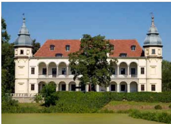
■ Krobielowice - pałac

wrócił dawną świetność założeniu. Remont trwał od 1992 do 1995 r. Obecnie istnieje tu hotel z centrum konferencyjnym i polem golfowym.