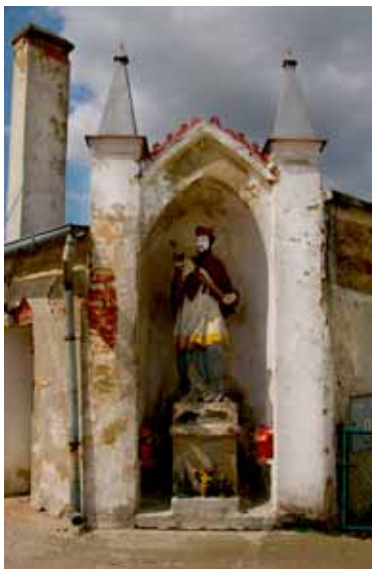
Wszemiłowice - figura św. Jana Nepomucena

Z pośród zabudowy wyróżnia się dom nr 20 z po-