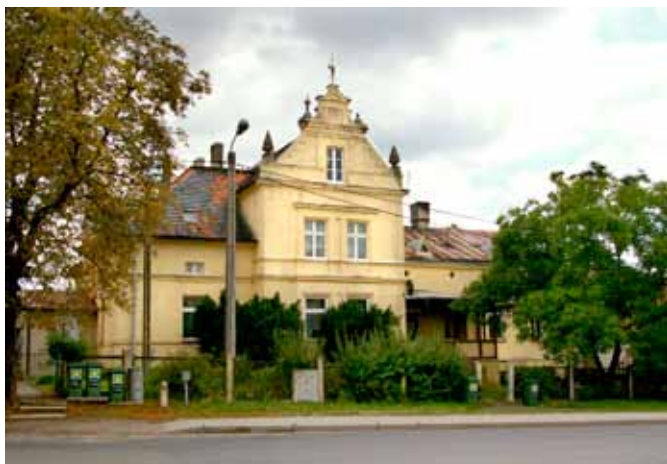
■ Pietrzykowice - willa Gimmlera ul. Fabryczna 1

Administracyjnie Pietrzykowice znajdowały się w powiecie Wrocław (Kreis Breslau), po II wojnie światowej, w latach 1945-1954 w gminie Smolec, obecnie Kąty Wrocławskie. Po 1945 r. teren cukrowni określano jako Pietrzykowice I, wieś - Pietrzykowice II pod zarządem ZPNZ (Zrzeszenie Państwowych Nieruchomości Ziemskich), przeznaczone do parcelacji i na PGR. Do lat 90-tych XX w. we wsi funkcjonował Zakład Przetwórstwa Owocowo-Warzywnego, na terenie dawnej cukrowni oraz Ferma Zwierząt Futerkowych.