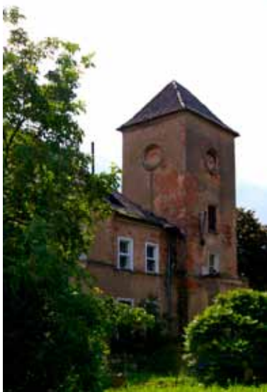
■ Jurczyce - pałac

Na północny zachód od rezydencji położone są zabudowania folwarku z lat 1860-1900 r., wokół prostokątnego dziedzińca. Dominuje ustawiona tuż przy drodze oficyna nr 8 z lat 60-tych XIX w., na planie prostokąta z dachem dwuspadowym, trójkondygnacyjna, murowana, otynkowana, z gzymsem kordonowym i podokiennym. Elewacja frontowa sześciosiowa, z wejściem w części centralnej, elewacje boczne trzyosiowe. Ostatnia kondygnacja z sześcioma parami okienek, zamkniętych łukiem pełnym. Front budynku w części centralnej podkreślony szczytem z krenelażem, ujętym poligonalnymi sterczynami.