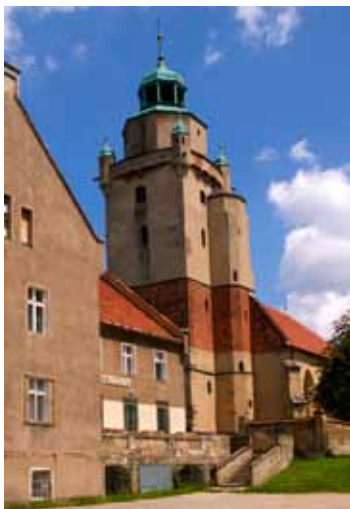
■ Kąty Wrocławskie - kościół katolicki p.w. św. Piotra i Pawła

Pod koniec XIII wieku Kąty jako osada targowa i miejsce przeprawy wodnej stanowiły szybko rozwijający się ośrodek miastotwórczy. Kościół stanął jako fara miejska w północnym narożniku lokowanego miasta.