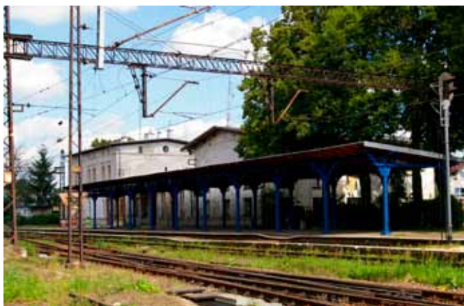
■ Kąty Wrocławskie - dworzec PKP

Kąty Wrocławskie do końca II wojny światowej pozostały miasteczkiem rolniczym, nastawionym przede wszystkim na przetwórstwo płodów rolnych.