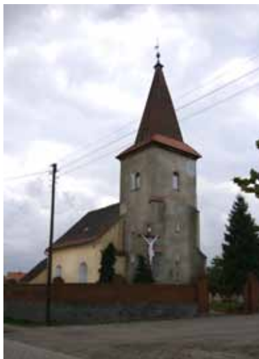
■ Kilianów - kościół