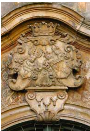
■ Chybczyce - herb w supraporcie

Karola Zygmunta założono barokowy ogród z parterami kwiatowymi w geometryczne wzory, z okrągłą altaną z kopułą na kolumnach jońskich. Tolos stanowił punkt centralny łączący ogród z parkiem, jednak został wyburzony w XIX w. Chybczycki pałac, podobnie jak większość okolicznych rezydencji, był orientowany w kierunku góry Ślęży, która stanowiła nie tylko dominantę w krajobrazie Niziny Wrocławskiej, ale również istotny element w kulturze niemieckiej.