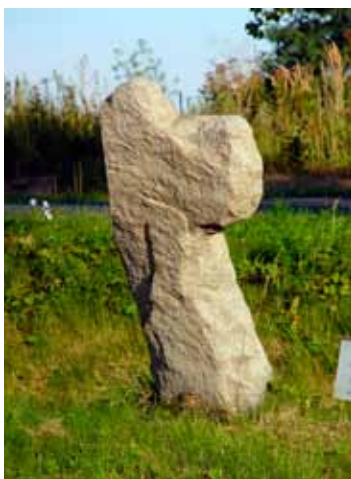
■ Kąty Wrocławskie - krzyż pokutny

Nazwa Thiemdorf pochodzi od wsi istniejącej w tym miejscu jeszcze w średniowieczu, a która w wyniku epidemii lub zniszczeń w czasie wojen husyckich przestała istnieć (prawdopodobnie około 1428 roku). W dawnych czasach opowiadano o tym miejscu sporo legend. Mówiono o duchu złotowłosej dziewczyny, o jeźdźcu bez głowy, o niepokojących dźwiękach, które słytać było w pobliżu. Nikt po zmroku nie zapuszczał się w te okolice, a las który porastał to miejsce, wydawał się przerażający i tajemniczy.