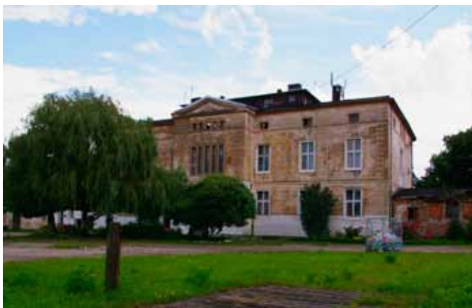
Małkowice - pałac

głównym - balkon z metalową barierką. Boczne ściany boniowane, całość spina gzyms międzykondygnacyjny.