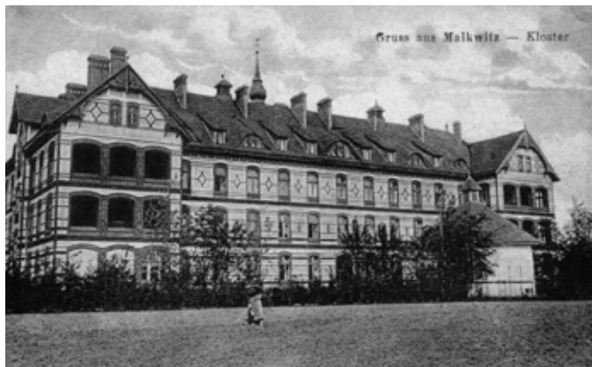
Malbork - dawny klasztor

wyróżnia się spośród innych wysoką klasą obróbki rzeźbiarskiej. Naprzeciwko kościoła, w pobliżu rzeki znajdują się zabudowania