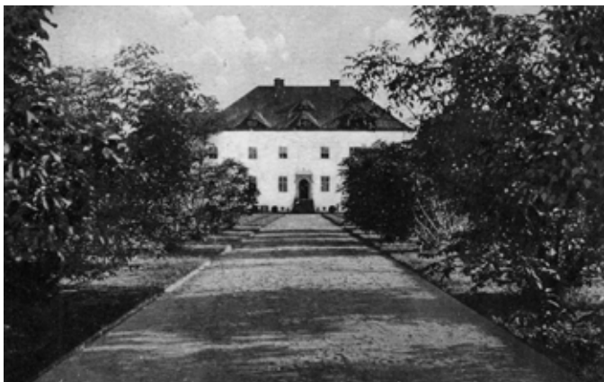
■ Zybiszów - zdjęcie pałacu z lat 30-tych XX w.

Dominującym elementem wsi pozostał dawny pałac, w otoczeniu folwarku i parku. Park krajobrazowy zlokalizowano od strony północnej, od południa wokół prostokątnego dziedzińca znalazły się zabudowania gospodarcze, z których w skrzydle wschodnim zachowała się dawna stajnia z oborą - obecnie magazyn, w skrzydle zachodnim obora - dziś również magazyn Stacji Doświadczalnej Oceny Odmian. Obecny pałac pochodzi z lat 20-tych XX wieku, jednak wcześniejsza rezydencja powstała prawdopodobnie ok. 1830 r. To budynek dwukondygnacyjny z poddaszem i suteroną. Dach czterospadowy z pięcioma lukarnami wole oczy. Wejście północne i południowe zdobią piaskowcowe portale z supraportami - portal północny o formie wklęsło-wypukłej, kształtem zbliżonej do korony, z podwieszoną latarnią z motywem liści akantu. Portal południowy półkolisty z belkowaniem i palmetą. Od wschodu dobudowano węższe skrzydło, a obecnie jeszcze dodatkowo parterową przybudówkę. Otwory okienne zmieniono. Pałac jest budynkiem mieszkalnym wielorodzinnym i siedzibą firmy rolnej. Zachował się fragment ogrodzenia z słupkami w formie zbliżonej do bastionów.