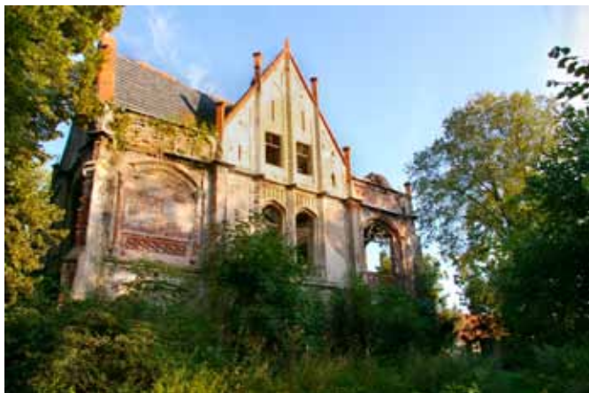
Stoszyce - pałac

Pałac jest orientowany w kierunku południowym, z osią widokową na Ślężę. Tego typu zabieg jest charakterystyczny dla większości rezydencji pałacowych gminy Kąty, co świadczy o dużym znaczeniu