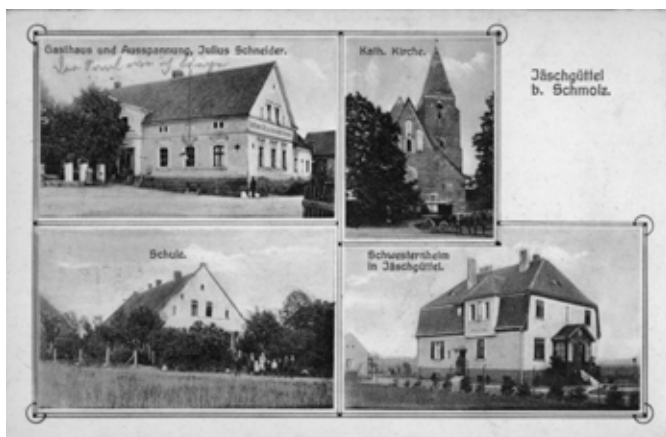
Jaszkotle - pocztówka z pocz. XX w.