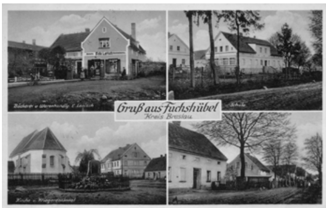
Strzegalowice - pocztówka z pocz. XX w.