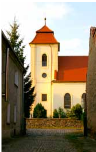
Pełcznica - kościół

Nazwa Polsnitz została zmieniona w 1937 r., ze względu na zbyt polskojęzyczne brzmienie. Od tej pory nazywano wieś Brückenfelde. Do 1945 r. Pełcznica podlegała administracyjnie pod powiat Środa Śląska (Kreis Neumarkt), po II wojnie światowej przydzielona do gminy Kąty Wrocławskie. W 1945 r. opuszczona przez Niemców wieś została przeznaczona do natychmiastowej parcelacji pomiędzy osadników. Gospodarstwa rolnicze typu indywidualnego oraz rzemiosło (głównie krawiectwo), również młyn, dawniej nazywany Vinzenzmühle, kontynuował działalność. Młyn Hintenmühle nie funkcjonował już przed 1945 r.