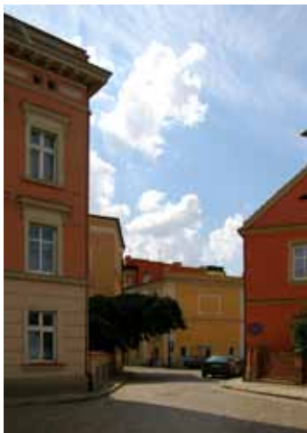
Kąty Wrocławskie - widok od str. ul. Świdnickiej

W roku 1907 przy ul. Mireckiego 7 powstał szpital prowadzony przez siostry elżbietanki. W owym czasie była to bardzo nowoczesna placówka z oddziałem zakaźnym, salą operacyjną i pierwszym na Dolnym Śląsku aparatem rentgenowskim. Gdy w latach 1935-1936 władze hitlerowskie zakazały siostrze działalności, przeniosły się one do innego budynku. W czasie II wojny światowej szpital nie