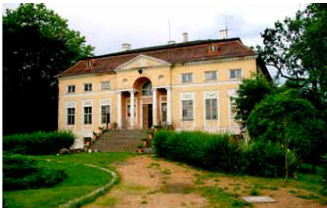
■ Samotwór - pałac