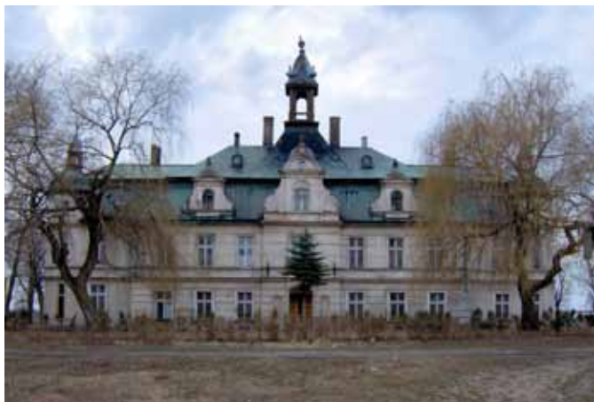
■ Kęłbówice - pałac

Od północy dziedziniec ogranicza stodoła z dobudowaną wiatą na maszyny rolnicze w północno-zachodnim narożu i budynkiem gospodarczym w części centralnej. Skrzydło wschodnie zabudowane zostało spichlerzem (po 1949 r. warsztat), do którego dostawiona była kuźnia (nie istnieje - zachował się komin i fragment pieca), za spichlerzem jeszcze dwie obory - na jednej z obór tablica kamienna z datą 19 marzec 1885 i inicjałami C. J. (Jesdinsky). Od południa podwórze zamykała druga stodoła, po pożarze w latach 80-tych XX w. została rozebrana.