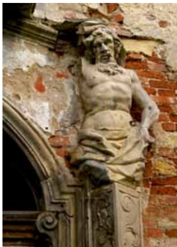
■ Kamionna – atlant, fragment portalu pałacowego

nadokiennymi naprzemiennie prostymi i falistymi, na piętrze okna ujęte w prostsze obramowanie zakończone zwornikiem w tynku. Cała elewacja spięta wielkim porządkiem z kapitelami kompozytowymi. Ryzalit frontowy zamknięty trójkątnym tympanonem z okulusem. Barokowy portal główny, z lat 1740-1744, z wejściem zamkniętym łukiem koszowym z kluczem zdobionym maszkaronem, ujęty dwoma hermami z rzeźbami atlantów, podtrzymujących balkon o barokowej balustradzie wklęsło-wypukłej, ażurowej, z dekoracją taśmową, wsparty był dodatkowo na dwóch wysuniętych kolumnach kompozytowych (obecnie nieistniejących). Otwór wejściowy balkonu powtarza łuk koszowy wejścia głównego - w bardziej spłaszczonej formie, zdobiony profilowaniem w tynku. Elewacja dziedzińca z zachowanymi trzema arkadami pełnołukowymi dawnych krużganków, fragment portalu renesansowego o zamknięciu półkolistym w skrzydle zachodnim. Dach obecnie niezachowany - w założeniu barokowym - mansardowy, pod koniec XIX wieku przykrycie czterospadowe spłaszczone.