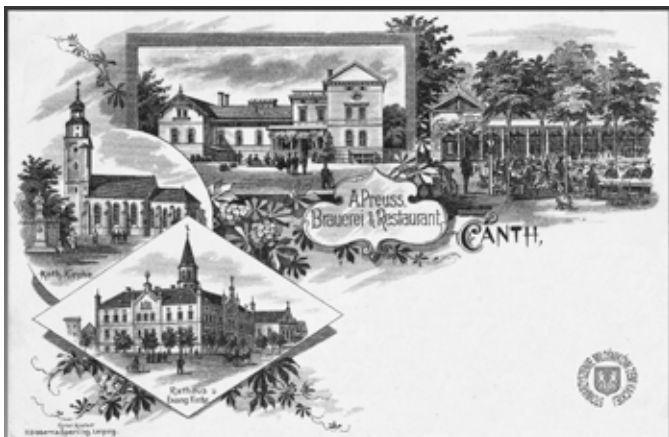
■ Kąty Wrocławskie - pocztówka z 1902 r. - kościół, dawny browar, ratusz

W miejscu istnienia dzisiejszego budynku Gminnego Ośrodka Kultury i Sportu, na północny-wschód od Rynku w średniowieczu stał gród warowny, strzegący przeprawy rzecznej przez Bystrzycę, a jednocześnie granicy między Księstwem Wrocławskim i Świdnicim.