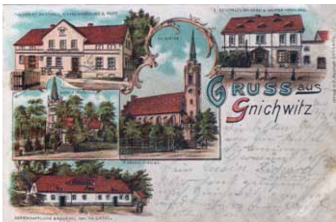
Gniechowice - pocztówka z końca XIX w. z widokiem obu kościołów

Badania archeologiczne potwierdziły ciągłość osadnictwa od czasów neolitu, ale w dokumentach historycznych wieś pojawia się dopiero w 1288 r. pod nazwą Gnekowiz, Gniechowiczi, w 1310 r. - Gnichwicz, Gnechewitz. Nazwa Gnichwitz została zmieniona po 1936 r. na Altenrode ze względu na polskojęzyczne brzmienie. Jest pewne, że już w roku 1299 Gniechowice posiadały własny kościół i proboszcza Wilhelma.