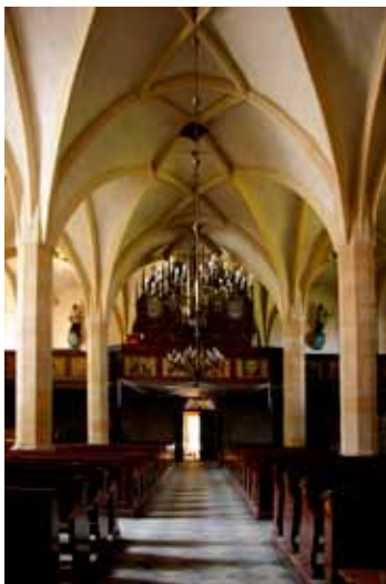
■ Kąty Wrocławskie - wnętrze kościoła p.w. św. Piotra i Pawła

Po I wojnie światowej przedsięwzięcie kościoła stał się miejscem upamiętnienia poległych na frontach wielu wojen mieszkańców miasteczka - pierwsza płyta upamiętniała żołnierzy wojen o zjednoczenie Niemiec (1866 prusko-austriacka, 1870-71 prusko-francuska), druga płyta to spis poległych w I wojnie światowej. Powojenne remonty to przede wszystkim restauracja wnętrza kościelnych, jeszcze w latach 50-tych XX w. usunięto neogotyckie polichromie, w latach 90-tych XX w. remontowano prezbiterium.