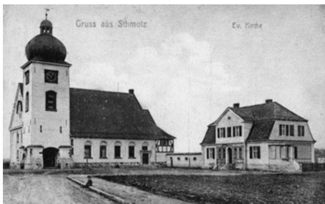
Smolec - kościół na pocz. XX w.

Plebania ul. Kościelna 4 powstała kilka lat później w roku 1910. Dwukondygnacyjna, ustawiona szczytowo do ulicy, z dachem łamanym z naczółkami. Ryzalit centralny pięcioosiowy z wejściem zakończonym łukiem pełnym, wyżej facjata trójosiowa i szczyt trójkątny z dachem dwuspadowym oraz owalnym oknem. Otwory okienne prostokątne z okiennicami. Budynek otynkowany z narożami boniowanymi.