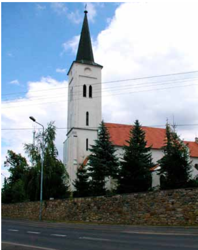
■ Gniechowice - kościół katolicki

W pobliżu folwarku rozciągał się park z przełomu XVIII i XIX wieku w stylu angielskiego parku krajobrazowego. Obok parku w miejscu dawnych ogrodów i szklarni pałacowych powstało osiedle, potocznie zwane „Na ogrodach”.