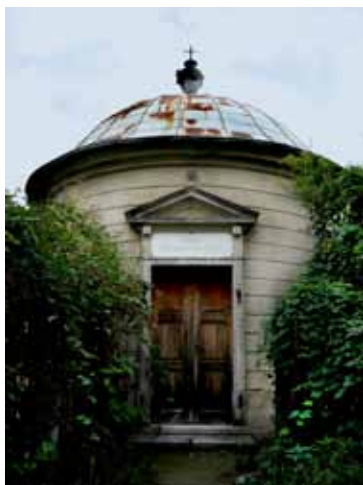
■ Sadków - mauzoleum von Rothkirchów