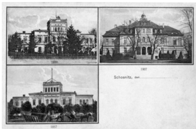
Sośnica - pałac w 1857, 1889 i 1907 r.