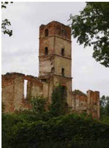
Smolec - ruiny pałacu

W otoczeniu fosi, którą można było przebyć mурowanymi mostkami, stał pałac na planie nieregularnego czworoboku, podpiwniczony, parter sklepiony kolebkowo z lunetami, na osi centralnej wieża na planie kwadratu, stanowiąca