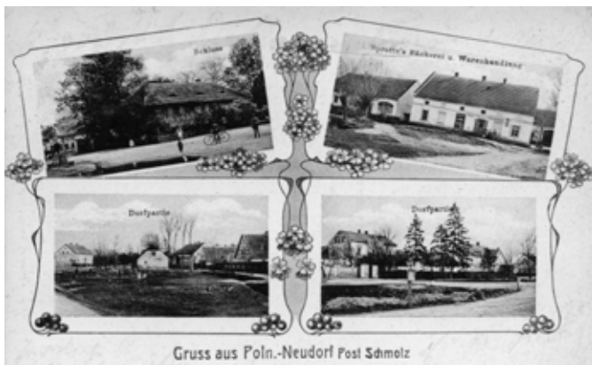
Nowa Wieś Wrocławska - pocztówka z XIX/XX w.

17 km na południowy zachód od Wrocławia, 14.5 km na wschód od Kątów Wrocławskich leży wieś ulicówka powstała ze średnio-wiecznego folwarku, przynależącego do posiadłości biskupów wrocławskich w Jaszcotlu - przez około dwieście lat istnienia, od XII do XIV wieku nie posiadała własnej nazwy. W 1382 r. została opisana w źródłach po raz pierwszy jako Jescutył alias Nouauilla. Od 1393 r. należała do kapituły katedralnej we Wrocławiu - w źródłach wspomniana jako Newdorff (1443, 1593 r.). Z czasem przyjęła się niemiecka nazwa Polnisch Neudorf.