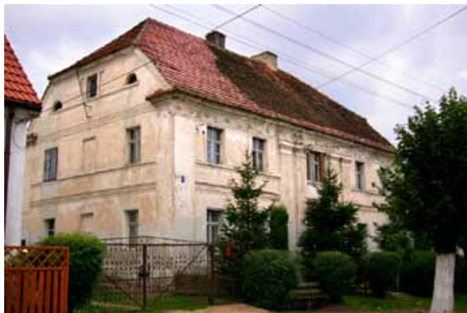
■ Kilianów - dom nr 27

Dom nr 17a to budynek mieszkalny z przełomu XVIII i XIX wieku, dwukondygnacyjny z dachem dwuspadowym, ustawiony szczytowo. Czterooosiowy, poszerzony o jedną oś jednokondygnacyjnej dobudówki, przykrytej dachem pulpitowym łączącym się z połacią dachu dwuspadowego - w efekcie uzyskano przełamanie połaci. Od strony drogi naczółek, od podwórza trzy lukarny wole oczy w dwóch rzędach. Elewacja boczna pięcioosiowa z częścią okien zamurowanych, wejście ujęte dwoma węższymi oknami, podobne rozwiązanie przy oknie na piętrze. Dom łączy się z oborą niższą o jedną kondygnację - naprzemiennie otwory okienne prostokątne i kwadratowe, otwory parteru zmienione. Kapliczka przy domu nr 17 z końca XIX wieku. Murowana, otynkowana, z dachem dwuspa-