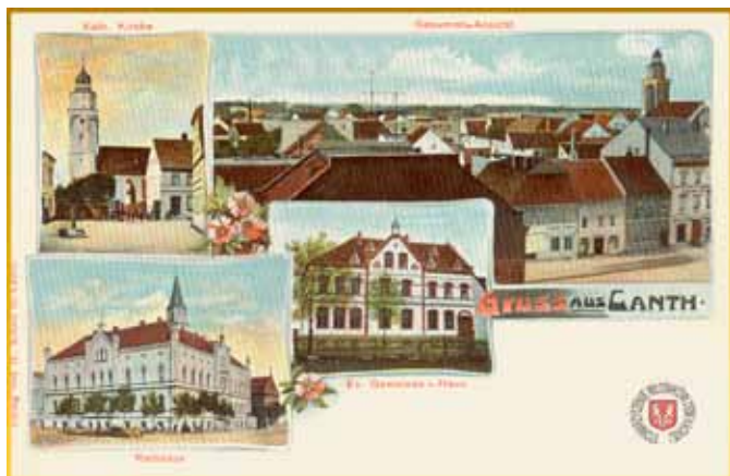
■ Kąty Wrocławskie - pocztówka z 1903 r.- kościół kat., widok z lotu ptaka, ratusz, nieistniejący Dom Wspólnoty Ew.

die Stadt Canth”, że osada i gród zostały spalone w czasie najazdu tatarskiego w 1241 r., żadne inne źródła tego nie potwierdzają. Miasto powstało pod koniec XIII wieku - Canth zostało założone na prawie magdeburskim przez księcia Bolka I Świdnickiego, a właściwie przejął prawa miejskie Milina, którego lokacja okazała się błędem. Kąty rozwijały się szybciej i miały lepszą lokalizację - w widłach rzeki Bystrzycy i Strzegomki, w pobliżu przeprawy wodnej, na skrzyżowaniu szlaków jeleniogórsko-wrocławskiego i legnicko-brzeskiego. Przejęcie praw miejskich książę Bolko I potwierdził w dwóch dokumentach z 25.10.1297 r. i 22.10.1298 r., sam akt lokacyjny nie zachował się. Prawdopodobnie spłonął w jednym z pożarów miasta. Głównym powodem lokacji prawdopodobnie była kwestia militarna. Zamek Canth, wzniesiony jako graniczna twierdza, stanowił ochronę względem Księstwa Wrocławskiego, pełnił również funkcję komory celnej. Pierwsze wzmianki pisane o nim pochodzą z 1293 r. Do roku 1474 pozostał w posiadaniu Piastów.