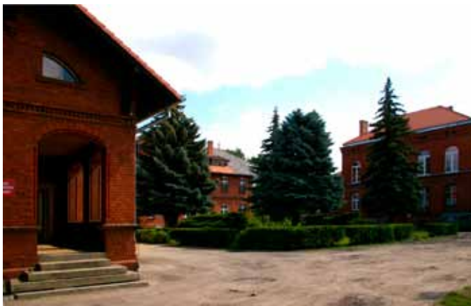
■ Kąty Wrocławskie - Dom Małego Dziecka

Początkowo istniały trzy budynki z ogrodem dla sześćdziesięciorga dzieci. W 1931 r. nastąpiła rozbudowa ośrodka. Wykupiono dodatkową działkę ziemi, na której stanęły kolejne trzy budynki i