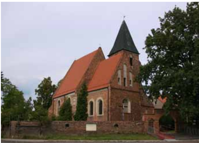
■ Jaskotle - kościół

stoi kamienna kapliczka w formie tokańskiej kolumny morowej św. Rocha, czczonego w całej Europie jako patrona chroniącego przed zarazą. Na cokole wyryto datę 1668, w głowicy kolumny na blasze wymalowano obrazki z życia świętego. W okolicy druga kolumna morowa znajduje się w Pełchnicy, obie prawdopodobnie powstały po lokalnej epidemii bądź miały przed nią chronić.