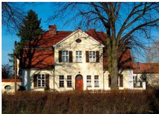
Smolec - plebania

Plebania ul. Kościelna 4 powstała kilka lat później w roku 1910. Dwukondygnacyjna, ustawiona szczytowo do ulicy, z dachem łamanym z naczółkami. Ryzalit centralny pięcioosiowy z wejściem zakończonym łukiem pełnym, wyżej facjata trójosiowa i szczyt trójkątny z dachem dwuspadowym oraz owalnym oknem. Otwory okienne prostokątne z okiennicami. Budynek otynkowany z narożami boniowanymi.