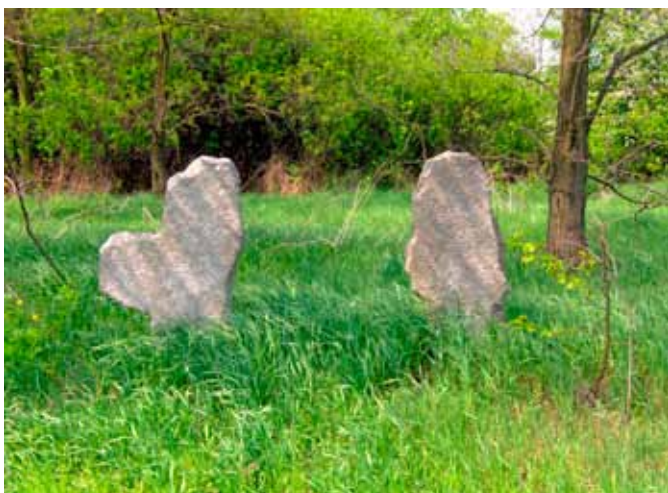
Smolec - krzyże pokutne na Karnczej Górze

W wyniku tego w pobliżu wsi (ul. Żwirki i Wigury) znalazł się cmentarz ewangelicki położony obecnie w granicach lotniska. Zachowane nagrobki z XIX wieku to jeden z nielicznych śladów istnienia wsi Kentschkau-Kęczków, zlikwidowanej po II wojnie światowej, w latach 50-tych XX wieku, podczas rozbudowy lotniska na Strachowicach. Wieś Kentschkau wzmiankowano pierwszy raz w bulli papieskiej z 1155 roku jako Carnchagora. Nazwa pochodzi od starosłowiańskiego słowa karnek lub Krk- oznaczała kalekę, czyli byłoby