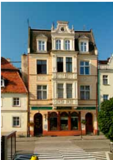
■ Kąty Wrocławskie - kamienica nr 26, Rynek

nych kamienic powstała w stylu neoklasycystycznym (ul. Świdnicka 5, 21 i Rynek 37). Z XVIII wieku pochodzi kamienica: Rynek 35 z obdasznicami, gzymsem na konsolach i wykończeniem sztukaterią. Kamienicę przy ul. Świdnickiej 35 prawdopodobnie równie starą - z XVIII wieku - wyróżnia wejście ujęte zdwojonymi pilastrami, powyżej balkon. Pod względem detalu architektonicznego uwagę przekłupa kamienica nr 26, w południowej pierzei Rynku. To kamienica trzypiętrowa z dachem mansardowym, pochodzi z