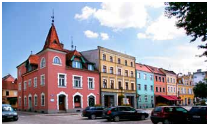
■ Kąty Wrocławskie - pierzeja wschodnia (z apteką)

Większość kamienic zachowanych na Starym Mieście pochodzi z XIX i początku XX wieku - w tym czasie wzniesiono na nowo, z trwalszych materiałów ceramicznych, kamienice na miejscu starych - drewnianych i fachwerkowych. Przeważająca część zachowa-