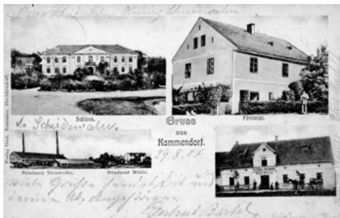
■ Kamionna - pocztówka z pocz. XX w. z widokiem pałacu i cegielnią w Stradowie

Pierwsza wzmianka o istnieniu osady Kammendorf została odnotowana w 1294 r. Z roku 1302 pochodzi informacja o Kemererdorff przy okazji regulacji granic wsi, od 1337 r. nazywana allodium Cammererdorf z nadania Jana Luksemburczyka, króla Czech. Od 1937 r. wieś nazywano Kammfeld bei Kanth.