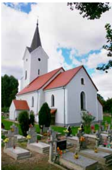
Wojtkowice - kościół

Kościół p.w. Św. Jana Nepomucena stanowi dominujący obiekt we wsi. Wzmiankowany po raz pierwszy w 1329 r. Obecny renesansowo-neogotycki, wzniesiono staraniem opata Jana Cyrusa w 1569 r., na miejscu starszego. Murowany, jednonawowy z węższym prezbiterium na planie kwadratu. Czworoboczna czterokondygnacyjna wieża z zachowanym herbem opata Jana Cyrusa. Między kruchtami a nawą zachowały się renesansowe portale z 1569 r. Wyposażenie w większości barokowe - ołtarz główny z około 1670 r. Do roku 1723 kościół był pod wezwaniem św. Wojciecha, wielokrotnie remontowany (w latach: 1760, 1812, 1843, 1853). W 1869 r. przebudowano wieżę. Kolejne renowacje miały miejsce jeszcze w latach: 1902, 1935, 1938. Kościół stał się pierwotnym miejscem spoczynku marszałka Blüchera do czasu wybudowania mauzoleum