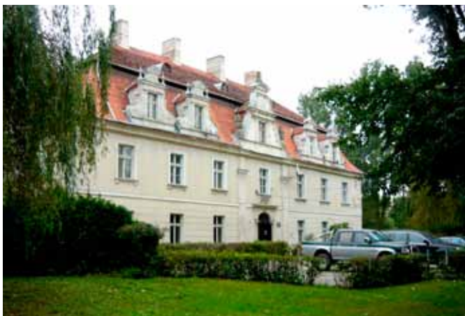
■ Sadków - pałac

Pałac przy ul. Parkowej znany jest w źródłach od XVI wieku. Po roku 1594 pojawiają się potwierdzone informacje o istnieniu renesansowego dworu nawodnego Szymona von Haniwaldt z Pilczyc i Żórawiny, prawdopodobnie pierwszą decyzją po zakupie wsi było zlecenie wybudowania dla siebie siedziby. Ślady pierwotnego dworu są obecne do dziś w fundamentach obecnego pałacu: piwnice, sień z czterema potężnymi kolumnami, na parterze pomieszczenia południowo-wschodnie ze sklepieniami kolebkowymi oraz południowa część zachodniego muru magistralnego o znacznej grubości. Dowodami na to, że ówczesna budowla była dworem otoczonym fosą są istniejący do dziś staw w pobliżu pałacu oraz bagnisty grunt na południe od niego. Posiadłość została odkupiona w roku 1714 od rodziny von Arzat przez Hioba Heinricha von Rothkircha (1682-1748), krótko po narodzinach jego pierworodnego syna Carla Siegismunda (1714-1791). Jednak renesansowy pa-