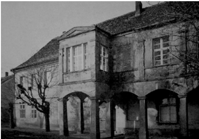
■ Gądów - pałac w latach 30- tych XX w.

Obok, w jednej linii zabudowy ze skrzydłem pałacu, znajduje się spichlerz z I połowy XIX wieku, murowany, otynkowany, dwukondygnacyjny z dachem naczółkowym. W kierunku południowym,