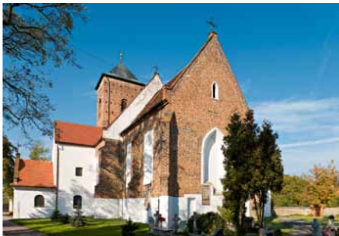
Sośnica - kościół

Najstarszym obiektem zabytkowym wsi jest kościół p.w. Podwyższenia Krzyża Św. Pierwszy kościół istniał już w 1244 r. W latach 1302-1319 biskup wrocławski Henryk ogłosił kościół sośnicki kościołem odpustowym pod wezwaniem Najświętszej Marii Panny. To okres wzmożonego ruchu pielgrzymkowego okolicznej ludności, który przerwany został w okresie protestantyzmu. Kościół podlegał protestantom w latach 1570-1653.