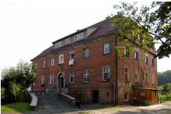
■ Gniechowice - dom nr 34 - dawny szpital