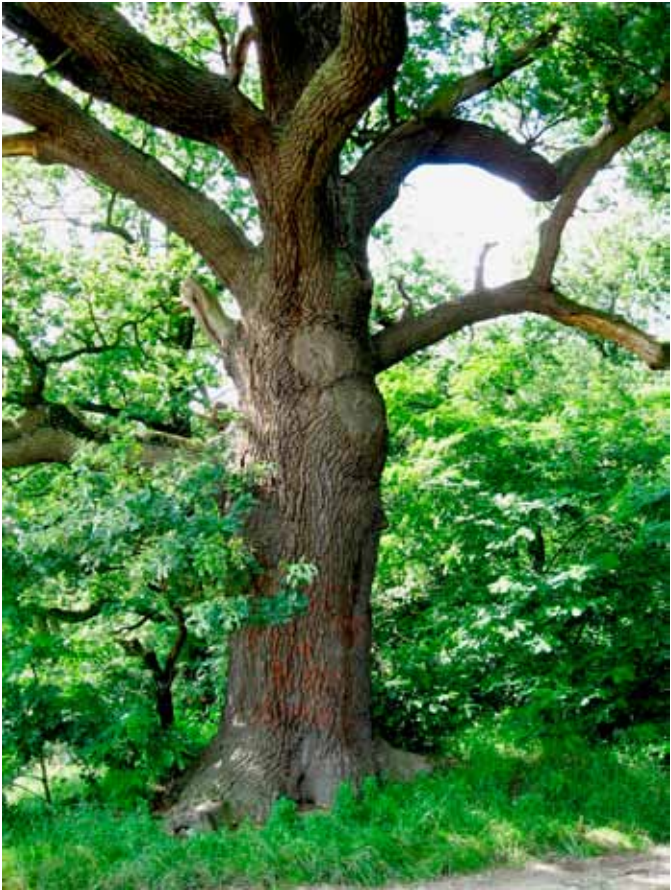
■ dąb w okolicy Skałki

zwyczajna, żaba trawna i wodna, ropucha zwyczajna, kumak zwyczajny, jaszczurka zwinka i zaskroniec. Spośród licznych gatunków ryb warto wymienić okonia, płoć, liczne kiełbie, a także ciernika, szczupaka, śliza, sandacza i leszcza. Zdarzają się unikatowe gatunki owadów: kozioróg dębosz, paż królowej, a także największa kolonia rzadkiego motyla przeplatki maturny.