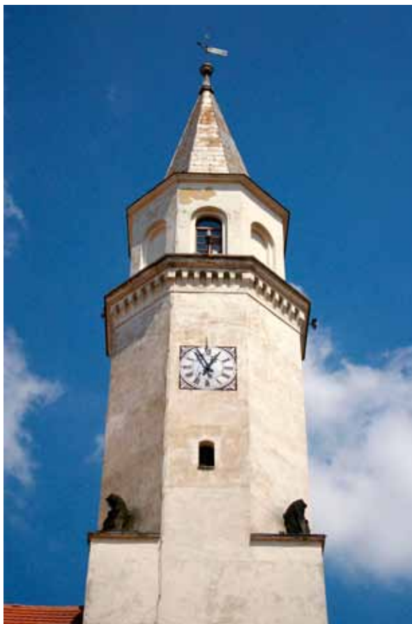
■ Kąty Wrocławskie - wieża ratuszowa od strony południowej