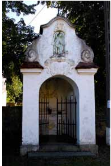
■ Bogdaszowice - kaplica w murze kościelnym