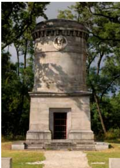
■ Krobielowice - mauzoleum G. Blüchera

wałaby się rzeźba lwa. Wejścia do mauzoleum miały strzec figury dwóch sfinksów. Generał von Zieten nadzorujący cały projekt, zakupił olbrzymi głaz granitowy w sobóckich kamieniołomach o masie zbliżonej do 589 680 kg. Głaz okazał się zbyt wielki, a prace zbyt drogie i projekt został zarzucony. Przypomniano sobie o feldmarszałku tuż przed setną rocznicą jego urodzin w 1842 r., a wtedy już sam król Fryderyk Wielki IV wsparł prace finansowo. Kamień