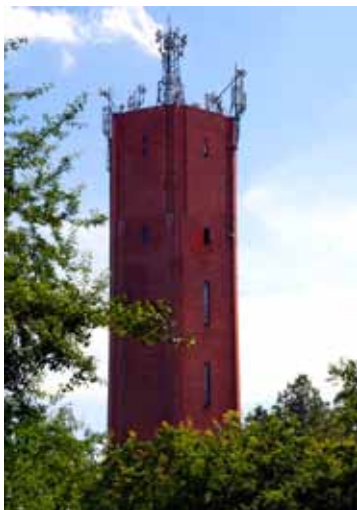
■ Kąty Wrocławskie - wieża ciśnień ul. Popiełuszki

cja kolejowa w Kątach Wrocławskich powstała w latach 40-tych XIX wieku. Warto zauważyć, że Kąty były stosunkowo ważnym przystankiem na trasie. Kiedy w 1844 r. sprowadzono z Anglii siedem pociągów, jeden z nich został nazwany Canth. Jeszcze przed I wojną światową na trasie kursowało po dwadzieścia pociągów dziennie w każdą stronę. Początkowo przeważał ruch towarowy - węgla, płodów rolnych i produktów rzemieślniczych. Z czasem transport osobowy zyskał na popularności. Obecny budynek dworca z drewnianą wiatą peronową pochodzi z lat 1867-1870. W latach 20-tych XX wieku powstała jeszcze wieża ciśnień przy kompleksie dworca.