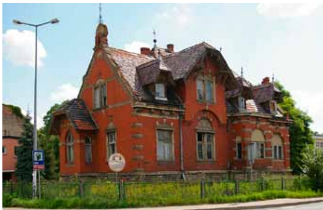
■ Kąty Wrocławskie - Willa Różana ul. Wrocławska

Willą Różaną, przy ul. Wrocławskiej 10. Na elewacji, wykończonej cegłą i kamieniem, z bogatym detalem, w stylu neobaroku niderlandzkiego, można odnaleźć symbole Łoży Masońskiej. Dziś nikt nie pamięta, z jakiego powodu zostały tam umieszczone.