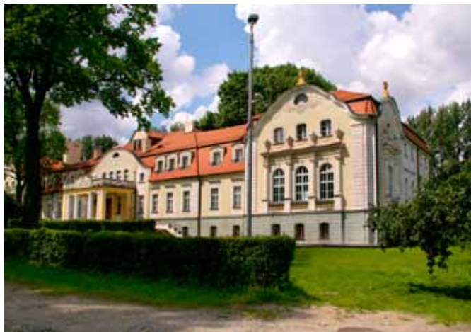
■ Sadowice - pałac

XIX wieku pochodzą oficyny mieszkalne: ul. Szkolna 4, ul. Szkolna 6/8, ul. Rzeczna 22 - do budynku przylegała szklarnia - zachowała się dekoracyjna konstrukcja szkieletowa z żelaza.