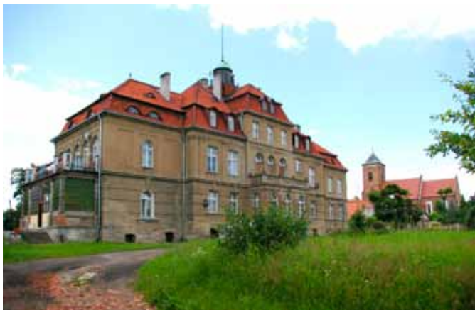
Sośnica - pałac