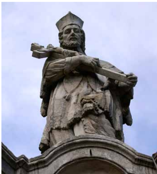
■ Kamionna - figura św. Jana Nepomucena