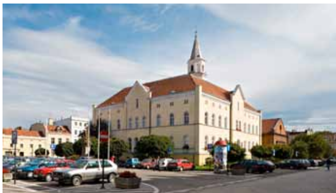
■ Kąty Wrocławskie - ratusz

Pierwszy ratusz spłonął w 1624 r. i przez wiele lat w obrębie bloku śródmiejowego stała samotna wieża ratuszowa, waga miejska, studnie i kramy, a od 1822 r. również pierwsza apteka. Renesan-