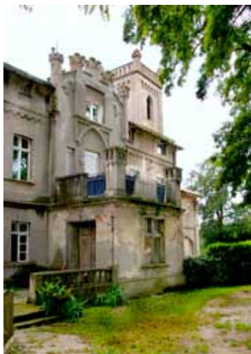
Rybnica - pałac

Na północny zachód od wsi, przy torach kolejowych stoi mały domek dróżnika, typowy dla architektury kolejowej końca XIX i początku XX wieku. Domek parterowy z użytkowym poddaszem. Na planie litery L - korpus i przybudówka - każda przekryta dachem dwuspadowym, o podobnie rozwiązanych elewacjach. Otynkowany, wykończenie cegłą licówką: przyziemie, opaski na wysokości okien, nadproża, schodkowy fryz podokapowy w ścianie szczytowej oraz naroża budynku. Wejście główne od