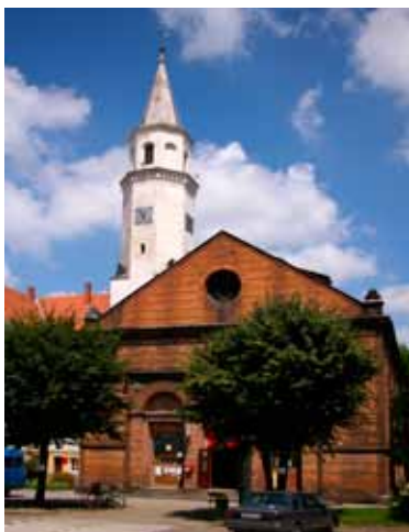
■ Kąty Wrocławskie - dawny kościół ewangelicki, Rynek

Większość mieszczan była wyznania ewangelickiego, jednak miasto do 1810 roku podlegało biskupom wrocławskim. Z nakazu biskupiego zarządcy świątynię rozebrano. W okresie reformacji od 1632 roku funkcję zboru pełnił kościół św. Piotra i Pawła. Po przywróceniu katolikom ich świątyni, nabożeństwa odbywały się prawdopodobnie w sali ratuszowej. Możliwość budowy kościoła pojawiła się dopiero po sekularyzacji majątku kościelnego w 1810 roku. Lata 1831-1833 to okres stara-