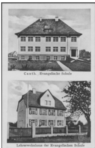
■ Kąty Wrocławskie - szkoła ewangelicka i dom nauczyciela ul. Żeromskiego

Ewangelicy przez długi okres czasu nie posiadali swojej szkoły. Jeszcze w połowie XVI wieku próbował nauczać prywatny nauczyciel, opłacany przez gminę ewangelicką, jednak szybko polecenie biskupie zabroniło tej praktyki. Wzmianki historyczne świadczą o tym, że pod koniec XVIII wieku próbowano prowadzić lekcje w kamienicy prywatnej, ale i tym razem szkoła została zamknięta. Dopiero po sekularyzacji w 1810 r. pojawiła się możliwość jej legalnego otwarcia. Przy ul.