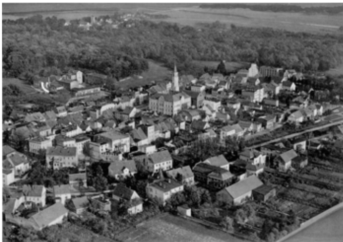
■ Kąty Wrocławskie - zdjęcie lotnicze z 1938 r.

Słowianie, jako grupa etniczna, pojawili się na tych terenach dopiero w VII wieku n.e. Według badań archeologicznych ziemie Kątów Wrocławskich były zamieszkiwane przez ludy prasłowiańskie, a najstarszy gród, pochodzący z przełomu VIII i IX wieku, znaleziono na obszarze Gniechowic. We wczesnym średniowieczu tutejsze strony należały do Ślązan, potem historia okolic Kątów była ściśle związana z historią całego Śląska.