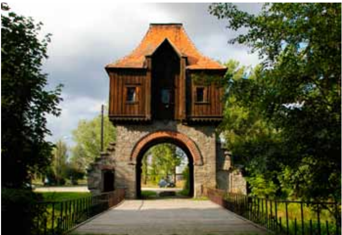
■ Krieblowice - brama

Opuszczona przez Blücherów w 1945 r. siedziba popadała w ruinę. Początkowo wieś przeznaczono do parcelacji spółdzielczej i dla osadników. W 1947 r. folwark dzierżawił Powiatowy Komitet Miejski PPS we Wrocławiu. Rok później PZPN, od 1949 r. do lat 90-tych XX wieku PGR. W ewidencji zabytków z 1958 r. zaznaczono, że o ile w 1945 r. pałac był w dobrym stanie, to już pod koniec lat 50-tych XX w. zastano go „częściowo zdewastowanego”. Książki i obrazy ze zbiorów kriebielowickich przejął Uniwersytet Wrocławski. Meble, porcelana, kolekcje sztuki częściowo wywieziono, część znalazła nowych właścicieli w okolicy. Pałac został przeznaczony na mieszkania dla pracowników gospodarstwa PGR, jednak w latach 70-tych XX w., po wybudowaniu bloków mieszkalnych, ostatni mieszkańcy opuścili go i popadł w ruinę. W 1978 r. przejęty przez Biuro Turystyki Młodzieżowej, od 1989 r. właścicielem został Urząd Miasta i Gminy Kąty Wrocławskie. W wyniku przetargu w latach 90-tych XX w. pałac odkupił potomek rodu Potockich i Blücherów, który przy-