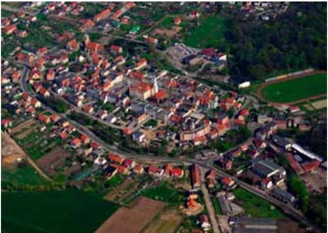
■ Kąty Wrocławskie - zdjęcie z lotu ptaka

Sprzedaż części gruntów, rozbudowa infrastruktury, rozwój oświaty i turystyki, uczyniły z gminy jeden z prężniej rozwijających się ośrodków miejskich Dolnego Śląska. Miasto postawiło na ekologię - powstał Park Krajobrazowy „Doliny Bystrzycy” i pierwsze ekologiczne wysypisko śmieci w powiecie wrocławskim, nowa oczyszczalnia ścieków. Rozwinęła się turystyka, zwłaszcza, że teren jest bardzo atrakcyjny i bogaty w pamiątki historii. Gmina, obok gminy Kobierzyce wciąż rozbudowuje przede wszystkim przemysł i usługi. Nowe zakłady powstają w Kątach, Pietrzykowicach, Nowej Wsi Wrocławskiej, Smolcu. W ostatnich latach nastąpił boom budowlany - bardzo szybko rozbudowują się osiedla domków jednorodzinnych w Bogdaszowicach, Kątach, Krzeptowie, Sadkowie i w Smolcu. Ustawiczne zmiany przyczyniają się do wszechstronnego rozwoju okolic.