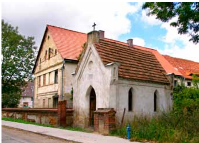
Wojtkowice - kaplica przydrożna

Do domu przylega od tyłu budynek gospodarczy, również dwukondygnacyjny z dachem dwuspadowym. Po drugiej stronie podwórza ustawiona kalenicowo obora z roku 1880, murowana z dachem dwuspadowym, połączona ze stodołą z tego samego okresu. Otwory wejściowe i okienne wykończone cegłą. Zachował się ceglany mur częściowo otynkowany, z pozostawionymi bez tynku ceglanymi słupkami i fryzem z ustawionych narożnie cegieł. Gospodarstwo jest dobrym przykładem bogatej zagrody XIX-wiecznej z wielopokoleniowym domem mieszkalnym i rozbudowanymi budynkami dla zwierząt hodowlanych i magazynowania plonów.