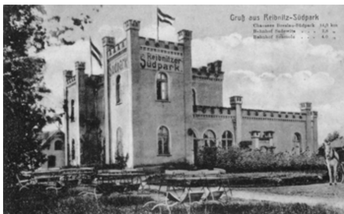
■ Rybnica - nieistniejący zajazd Reibnitzer Südpark

W lasku, który obecnie porasta to miejsce, nie zachował się żaden ślad, jednak nazwa „Zichpark”, brzmiąca podobnie do niemieckiego określenia Südpark, funkcjonuje do dziś w mowie potocznej.