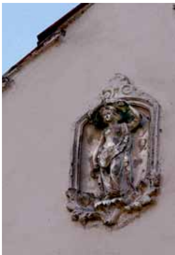
■ Kozłów - płaskorzeźba - dom nr 7

dualne, pozostała do dziś wsią rolniczą.