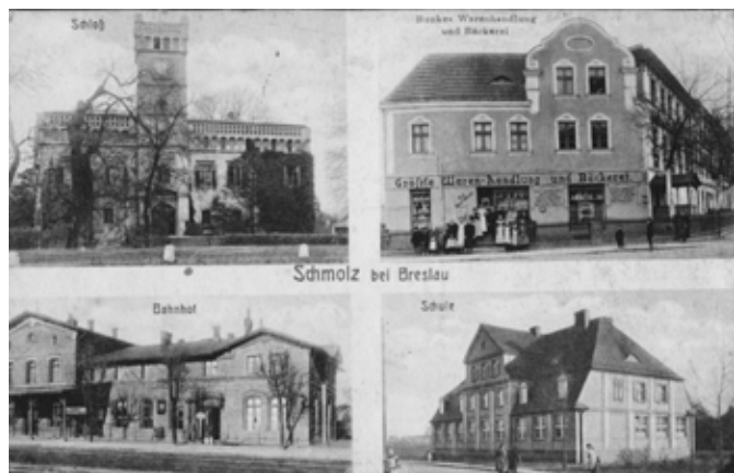
Smolec - pocztówka z pocz. XX w. - pałac, kamienica ul. Główna, dworzec, szkoła

Wieś położona 14 km na południowy zachód od Wrocławia, 16.5 km na północny wschód od Kątów Wrocławskich.