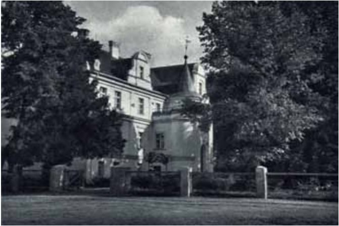
Bliz - pałac w latach 30-tych XX w.