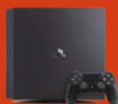
Konsola Sony PlayStation