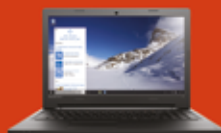
Laptop Lenovo IdeaPad