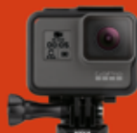
GoPro HEROS Black