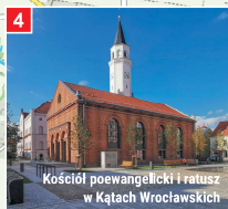
Kościół poewangelicki i ratusz w Kątach Wrocławskich