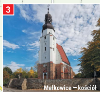
Malkowice - kościół