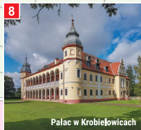
Pałac w Krobielowicach