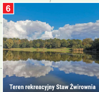
Teren rekreacyjny Staw Zwirownia