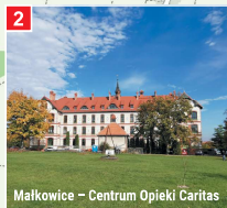
Malkowice - Centrum Opieki Caritas