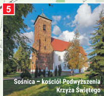
Sośnica - kościół Podwyższenia Krzyża Świętego